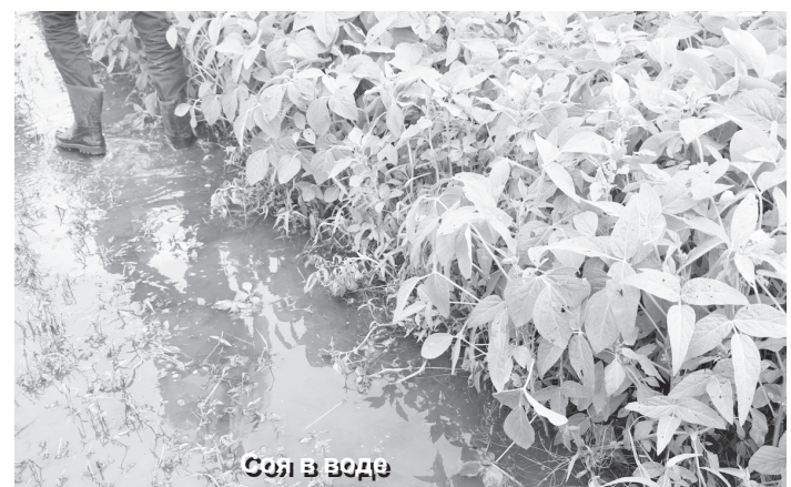
Соя в воде