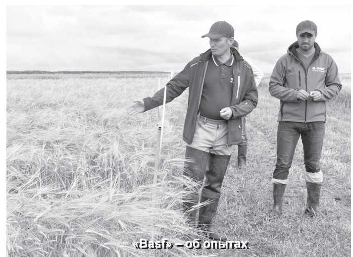
«BASF» – об опытах