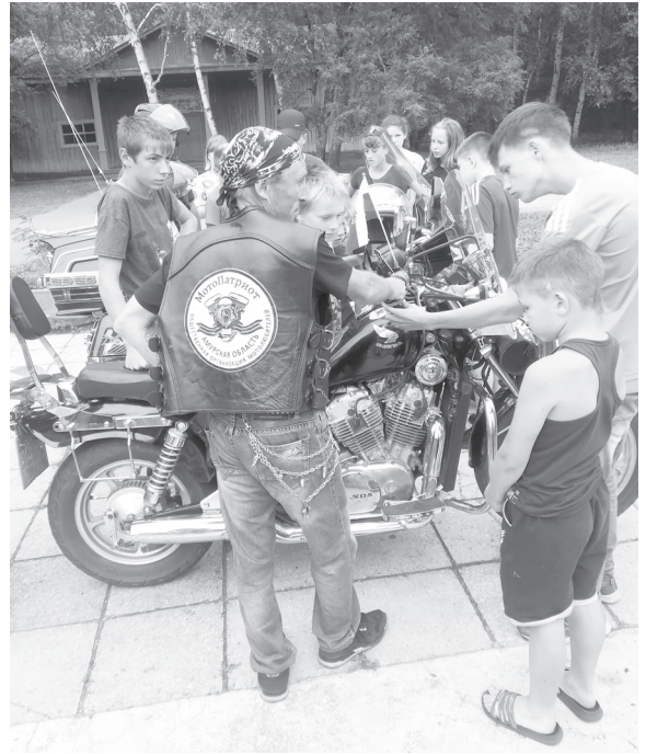
В конце встречи все желающие смогли примерить мотошлем и экипировку, посидеть на байке и сделать фото с оружием на память.

цикл» и «Госуслуги, не выходя из дома». К мальчикам и девочкам, отдыхающим в лагере, и персоналу приехали сотрудники ГИБДД, Росгвардии, а также представители Амурской областной общественной организации «Мотопатриот». Сотрудники полиции напомнили ребятам о важности соблюдения Правил дорожного движения, а также о способах получения государственных услуг в сфере безопасности дорожного движения, а байкеры познакомили детей со своими «железными конями», продемонстрировали мотоэкипировку и рассказали, почему так важно во время движения использовать вело- и мотошлемы. Также с отдыхающими в лагере детьми поговорили о Родине и патриотизме, а привезенное стрелковое оружие времен Второй мировой войны напомнило ребятам, как непросто досталась Победа нашим воинам.