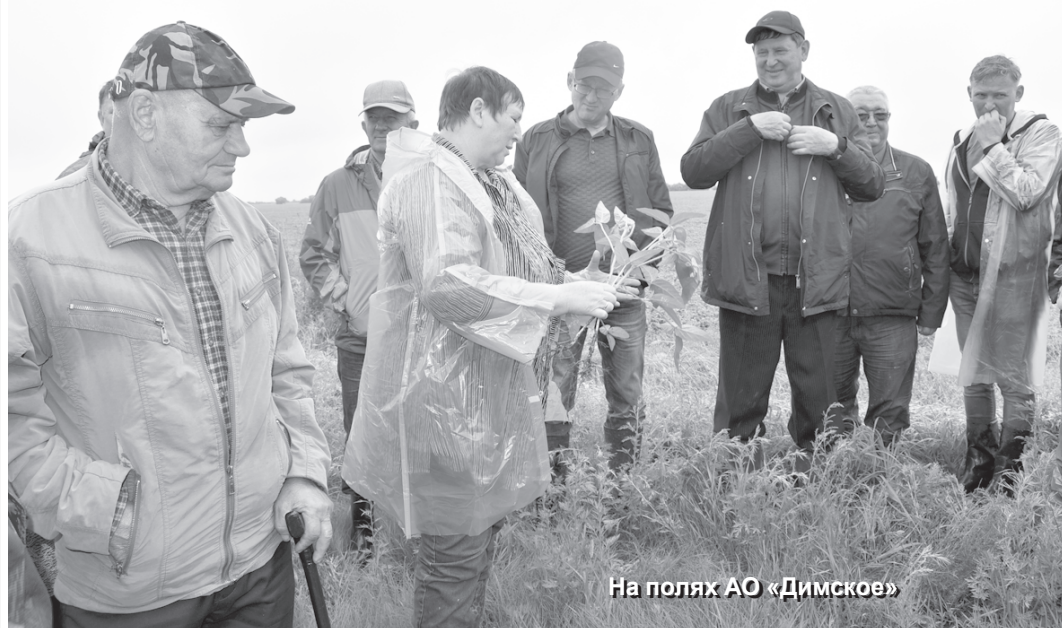
На полях АО «Димское»