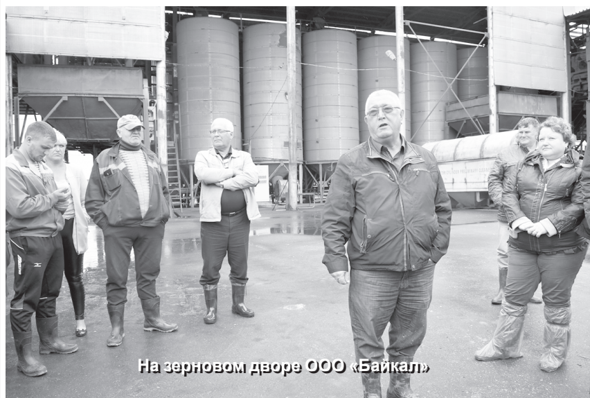
На зерновом дворе ООО «Байкал»