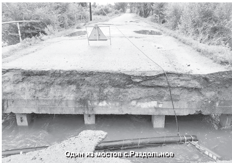
Один из мостов с.Раздольное