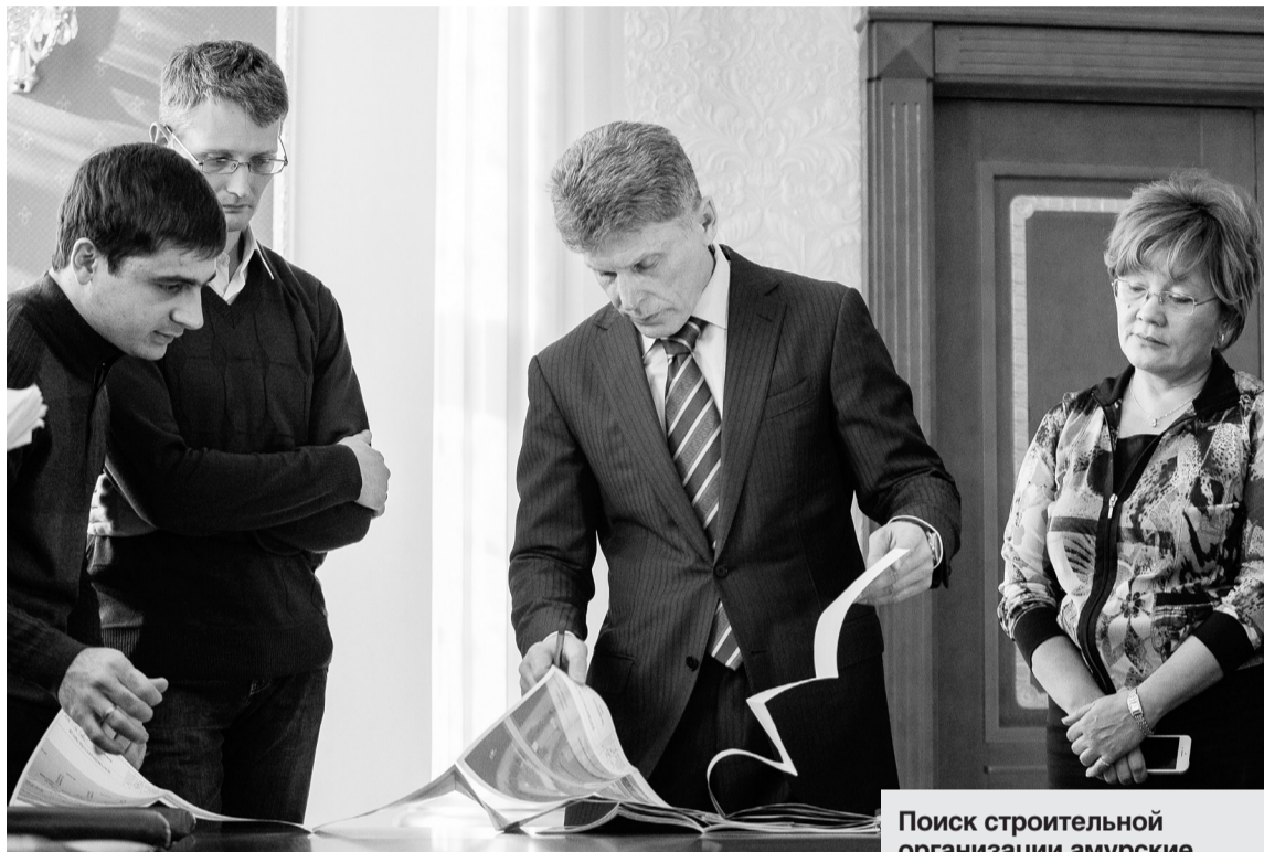
Поиск строительной организации амурские власти начнут с весны 2014 года

миллионов рублей составила стоимость проекта второго моста через реку Зею в Благовещенске.