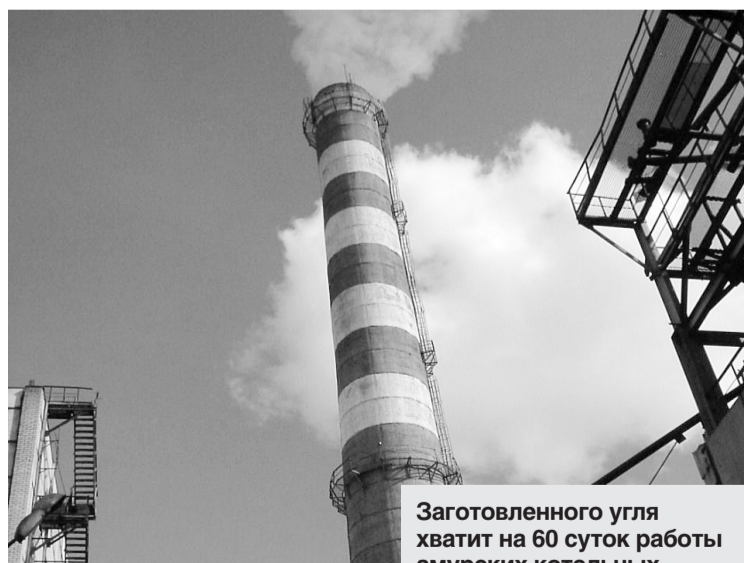
Заготовленного угля хватит на 60 суток работы амурских котельных

Уголь поступил с разрезов Красноярского края. Топливо реализуется населению по ценам, которые не включают в себя стоимость железнодорожного тарифа. Она оплачивается за счет средств федерального бюджета согласно Указу Президента РФ «О мерах по ликвидации последствий крупномасштабного наводнения на