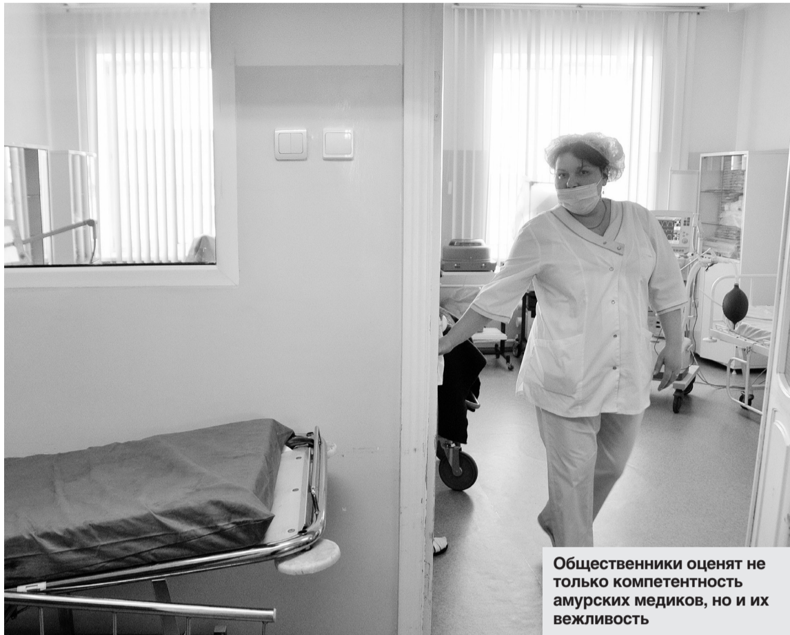
Общественники оценят не только компетентность амурских медиков, но и их вежливость