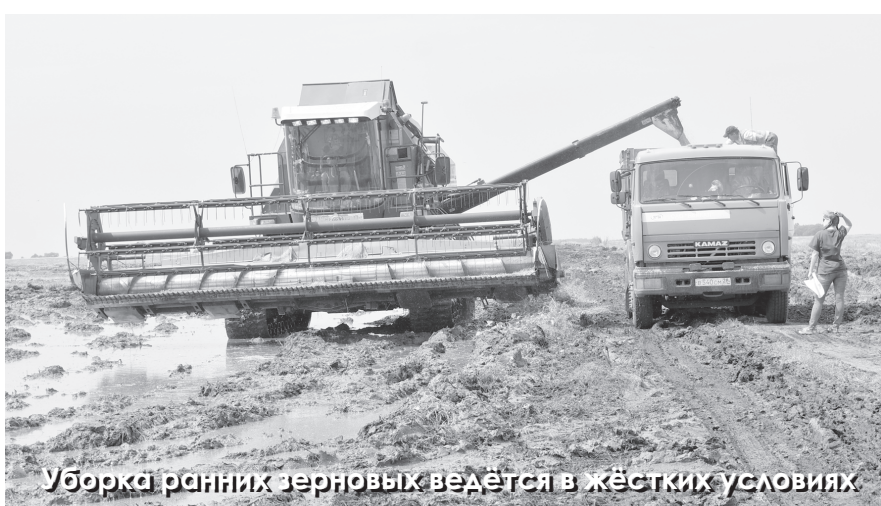
Уборка ранних зерновых ведётся в жёстких условиях

«Вода, вода, кругом вода!» Такими постами пестрит Интернет. На сегодняшний день это, пожалуй, самая актуальная тема для обсуждений. И не удивительно. Затянувшиеся дожди вносят свои коррективы в размерный быт не только рядовых сельчан, но и сельских тружеников.