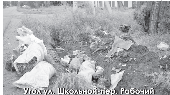
Угол ул. Школьной-пер. Рабочий

Нынешним дождливым летом все кюветы заполнены водой и... мусором. Наши граждане упорно кладут туда мешки с мусором. Региональный оператор увозит их не полностью, собаки делают свою работу и Тамбов-