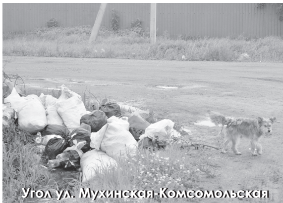
Угол ул. Мухинская-Комсомольская

ветах. Когда весной сельсовет устанавливал колышки для мусорных площадок, никто не задумался, что ставит их в кювет.