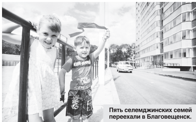
Пять селемджинских семей переехали в Благовещенск.

Квартиры для переселенцев были подобраны из реестра готового жилья в городах Благовещенск, Тынды и селе Чигири Амурской области. Расселяемая