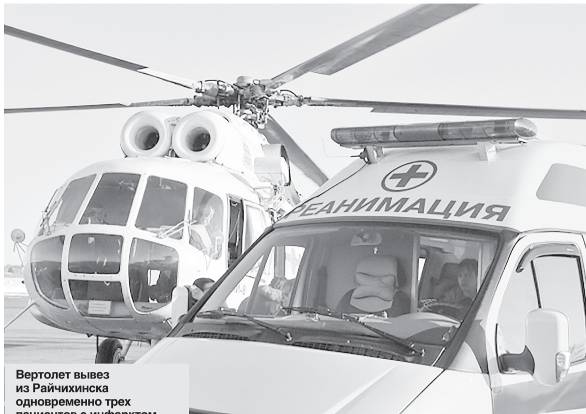
Вертолет вывез из Райчихинска одновременно трех пациентов с инфарктом и беременную женщину.