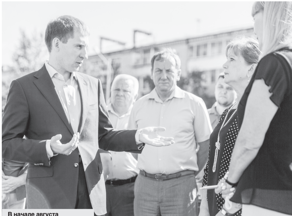
В начале августа Александр Козлов с министрами и руководством Благовещенска проверил ремонт дорог областного центра.

К началу осени в Приамурье отремонтируют 300 километров региональных и 15 километров местных дорог.