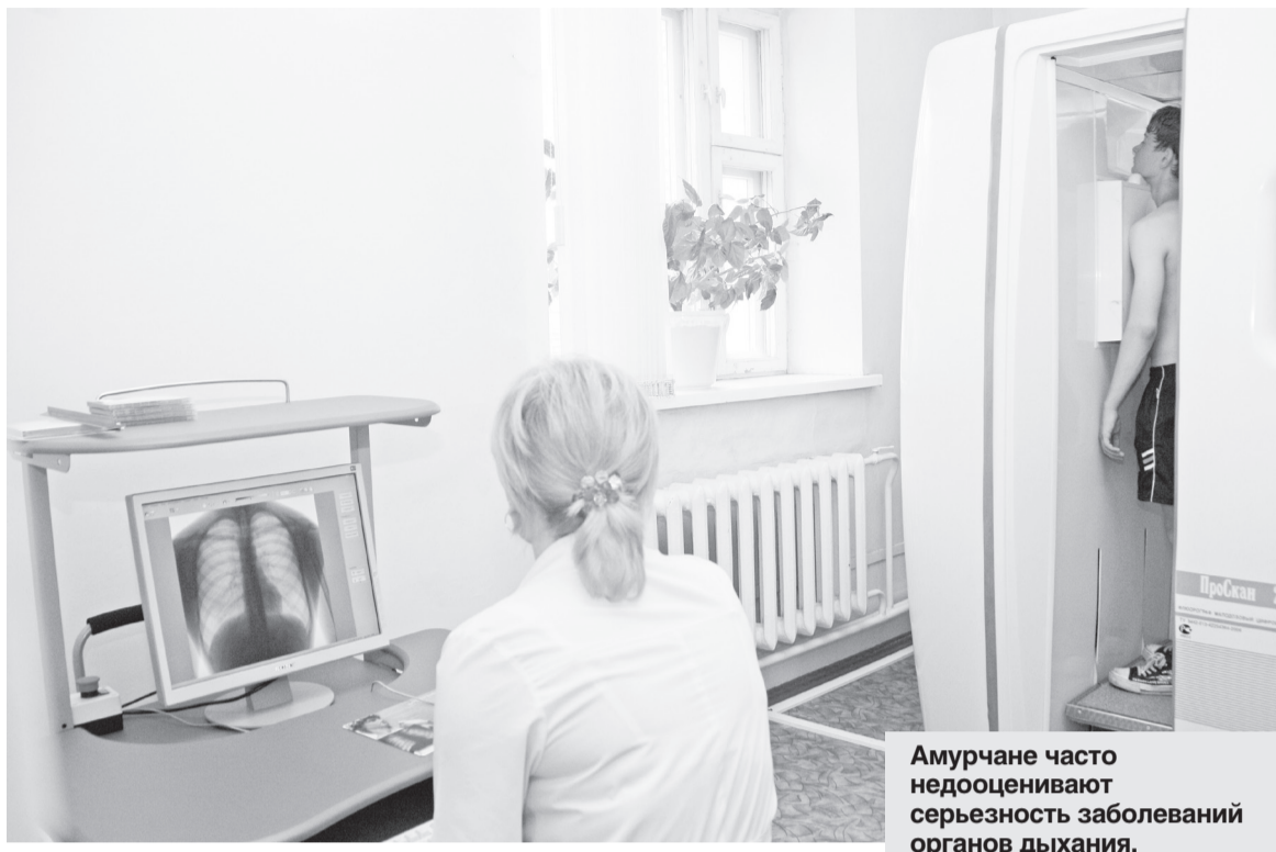
Амурчане часто недооценивают серьезность заболеваний органов дыхания.

Высокий уровень смертности, как показал анализ двух территорий — Бурейского и Тамбовского районов, обусловлен двумя основными проблемами. Первая — это отсутствие стационарной помощи у самого населения к риску печального исхода ряда заболеваний органов дыхания. Как показывает анализ исследований, многие считают пневмонию, бронхиальную астму, хроническую обструктивную болезнь легких (ХОБЛ) и другую патологию легких безопасными для жизни. К сожалению, это не так, констатируют медики. Именно поэтому, считают они, диспансеризация людей с такими заболеваниями должна быть