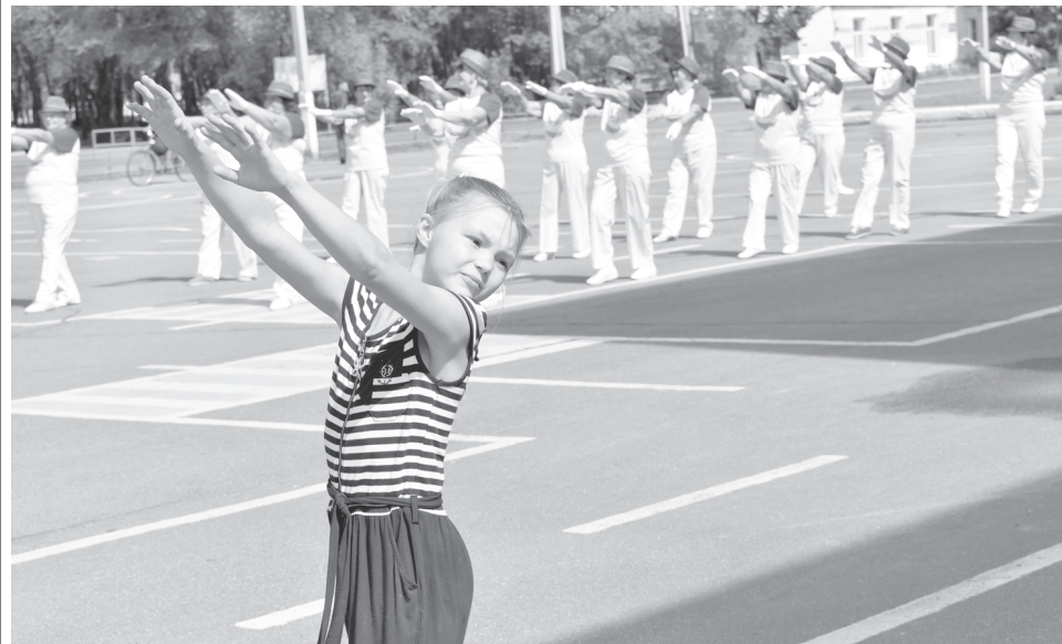
Селу Свободка - 140 лет!