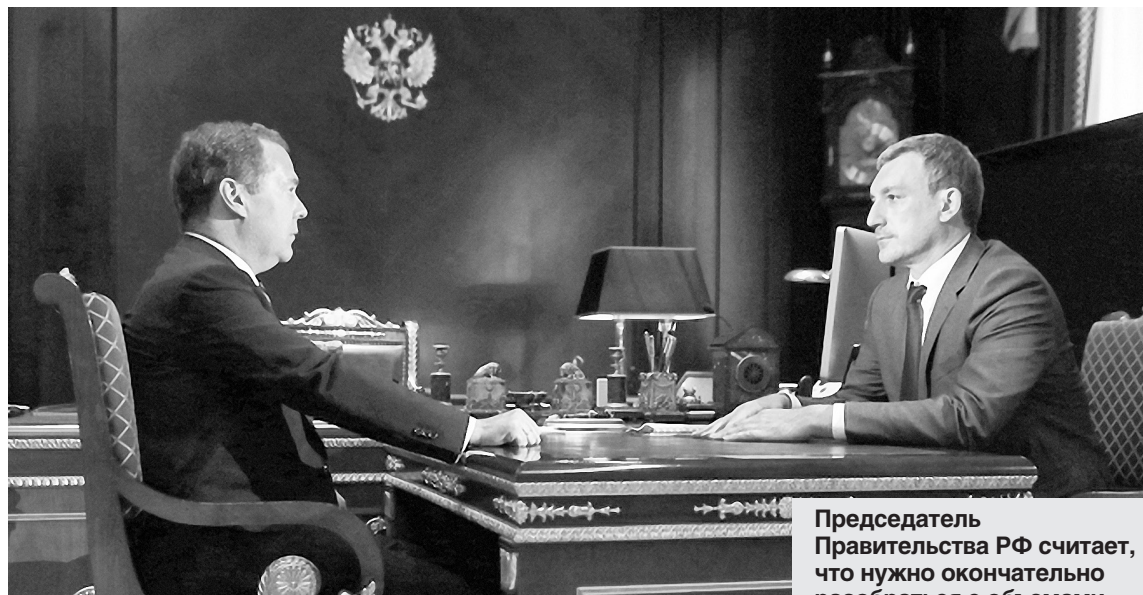
Председатель Правительства РФ считает, что нужно окончательно разобраться с объемами бедствия в Приамурье.

— Поручения я, конечно, дам: и в адрес Минфина, и в адрес других ведомств, которые этим