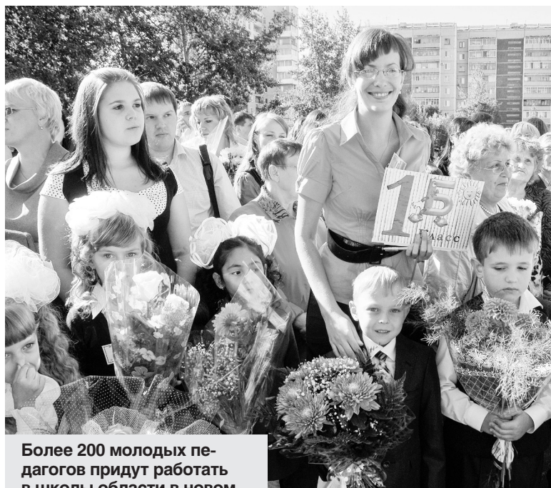
Более 200 молодых педагогов придут работать в школы области в новом учебном году.

в школах области работали 112 будущих учителей. Они не только «закрыли» 44 вакансии, имевшиеся в начале сентября, но и снизили учебную нагрузку педагогов, — прокомментировала и. о.