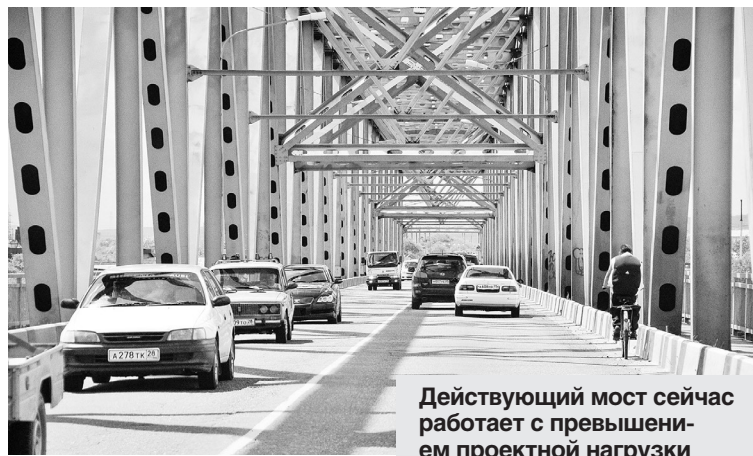
Действующий мост сейчас работает с превышением проектной нагрузки в шесть раз.

моста — очень важная задача для нас. Действующий мост сейчас работает с превышением проектной нагрузки в шесть раз. Учитывая, что с вводом в эксплуатацию международного моста через Амур автомобильный трафик значительно возрастет, решать вопрос необходимо опера-