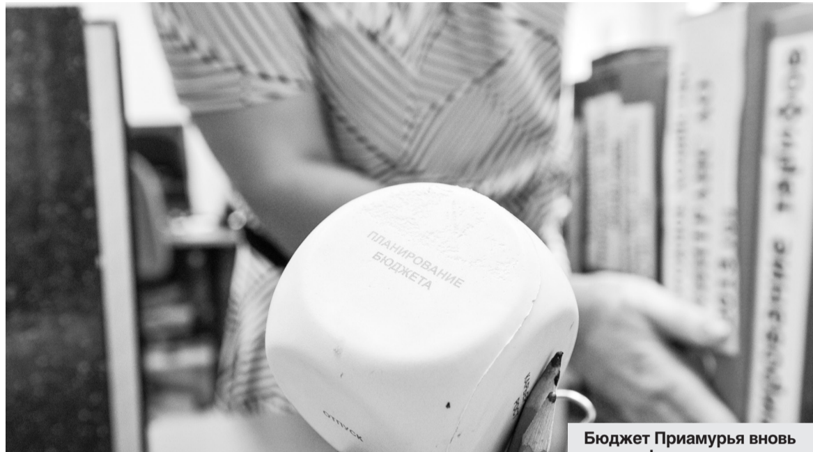
Бюджет Приамурья вновь стал дефицитным, и это, как ни странно, плюс для региона.

Второй источник, пополнивший бюджет, — налоговые