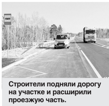
Строители подняли дорогу на участке и расширили проезжую часть.

В декабре 2017 года готовую трассу осмотрела специальная комиссия. Она выявила несколько недочетов. Так, ГИБДД