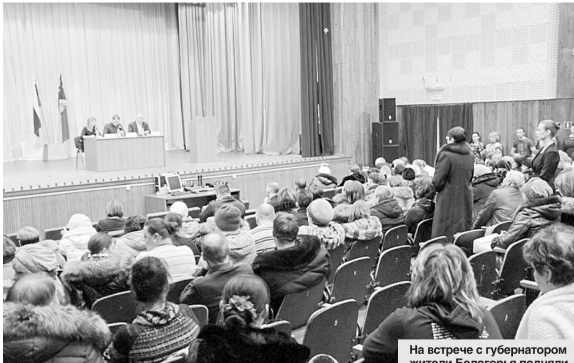
На встрече с губернатором жители Белогорья подняли наиболее актуальные вопросы.

— Мы работаем на прием, чтобы определить цели, к кото-