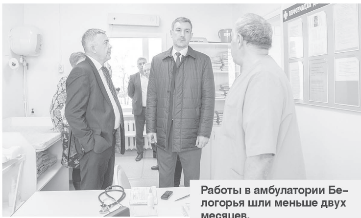
Работы в амбулатории Белогорья шли меньше двух месяцев.

Работу медучреждения не прекращало даже в самый разгар ремонта. Из нового, что появилось в амбулатории: пять коек дневного стационара. «Не сравнится с тем,