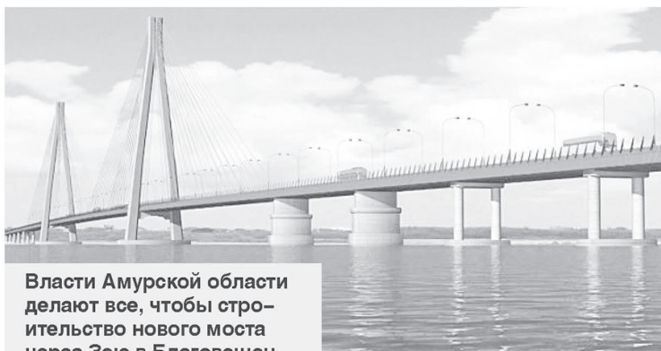
Власти Амурской области делают все, чтобы строительство нового моста через Зею в Благовещенске началось раньше.

ральные деньги пойдут на поддержку семей с детьми, формирование эффективной системы образования, совершенствование механизмов предоставления мед-услуг, повышение уровня жизни граждан, создание комфортных условий для их проживания. Только на поддержку системы образования будет дополнительно направлено 1,2 миллиарда рублей. Перед регионами поставлены задачи развивать вариативные модели дополнительного образования для детей. Создание мобильных технопарков «Кванториум», Центра развития современных компетенций детей «АмурТехноЦентр» будет способствовать внедрению инно-