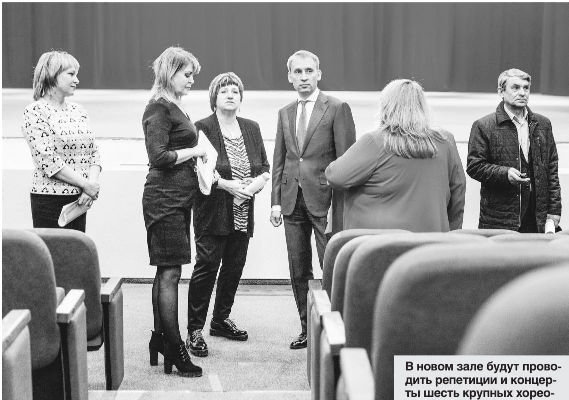
В новом зале будут проводить репетиции и концерты шесть крупных хореографических коллективов, включая «Ровесников».

В помещении заменили пол, сделали косметический ремонт стен, установили комфортные кресла, рассказала начальник