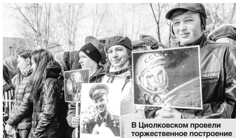
В Циолковском провели торжественное построение сотрудников ракетно-космической отрасли.