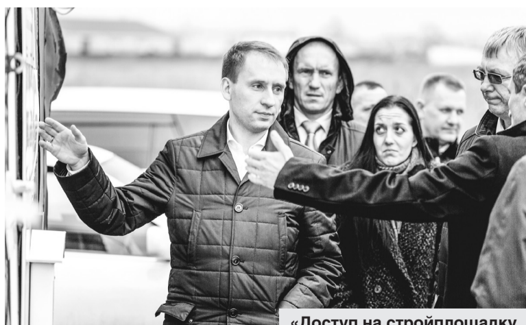
«Доступ на стройплощадку к стенду для дольщиков нельзя ограничивать», — предупредил губернатор.

— Ответственный специалист в министерстве транспорта и строительства региона ежедневно утром и вечером должен присутствовать на планерках строительной организации на площадке. Информационные встречи с дольщиками в моем присутствии или в присутствии моих заместителей будут про-