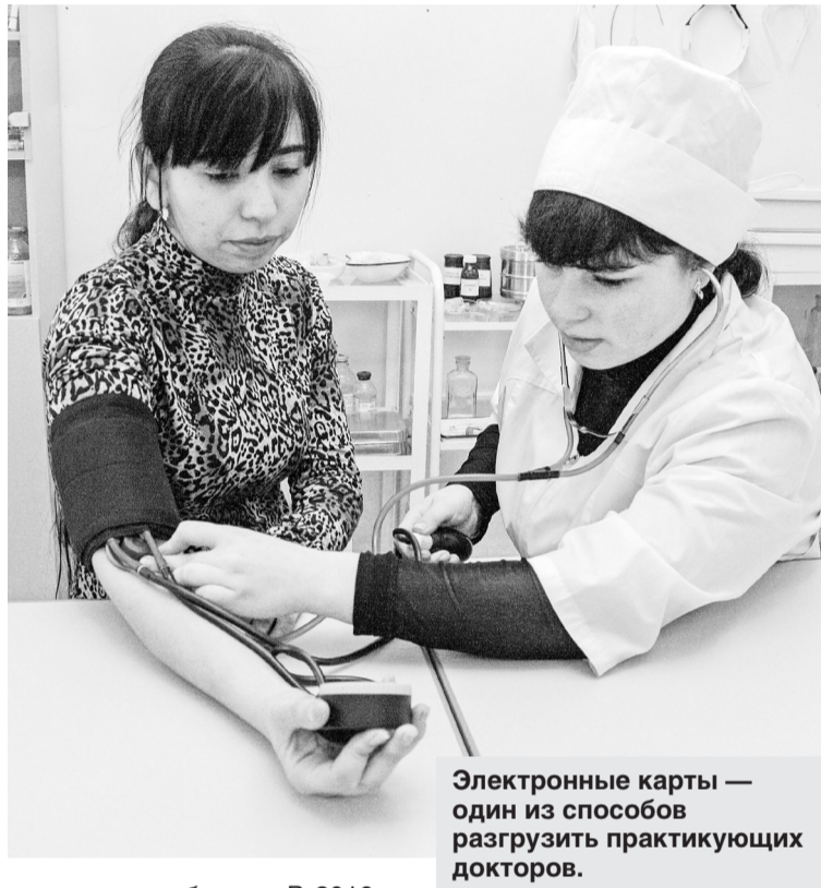
Электронные карты — один из способов разгрузить практикующих докторов.

Главный результат работы за год — рост продолжительности