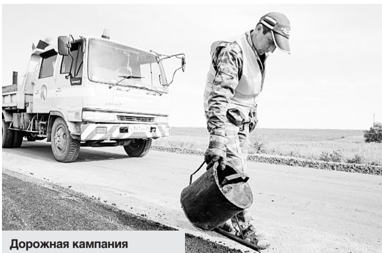
Дорожная кампания в регионе должна завершиться до октября 2017 года.

Всего на ремонты дорог городам и районам в этом году выделено более одного миллиарда рублей. На эти деньги приведут в порядок 150 километров дорог. Основной упор будет сделан на работы, связанные с установкой освещения, обустройством тротуаров и водоотведением.