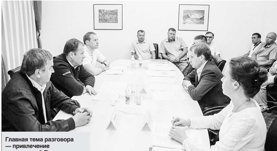
Главная тема разговора — привлечение предприятий Приамурья на строительстве второй очереди космодрома.

изошли достаточно серьезные изменения, мы видим, что увеличилась численность рабочих, мы вышли на уровень даже выше планируемого, это внушает серьезный оптимизм. Решены все вопросы по финансированию работ, мы видим, что предприятие ЦЭНКИ (Космодромы России) взяло под контроль закупку всего оборудования и материалов,