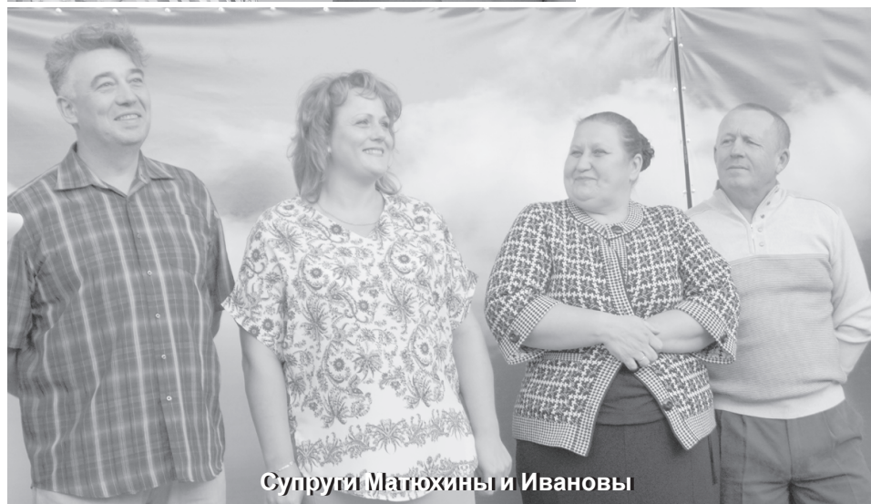
Супруги Матюхины и Ивановы