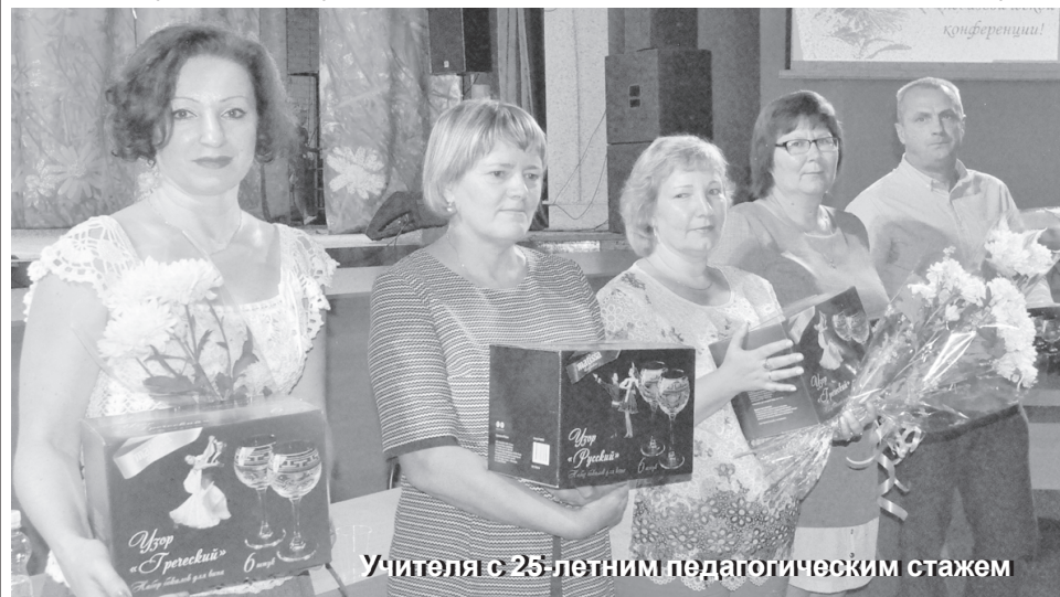
Учителя с 25-летним педагогическим стажем

На начало 2017-2018 учебного года сеть образовательных организаций района осталась без изменений. В ее составе - 12 общеобразовательных учреждений с 5 филиалами, 9 дошкольных образова-