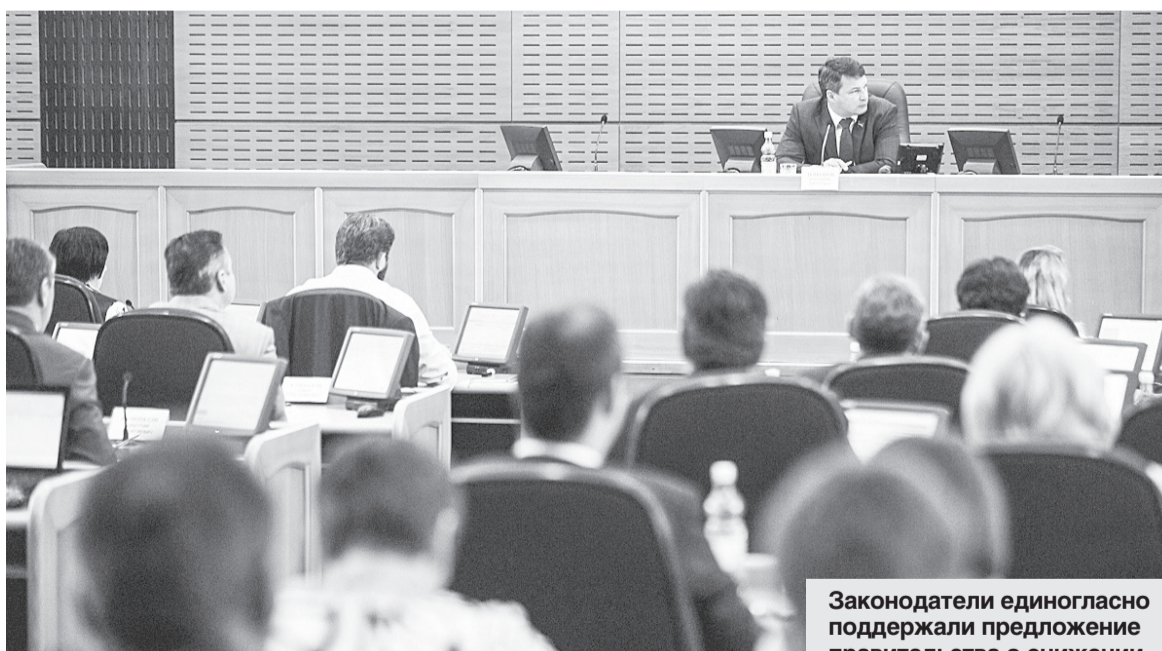
Законодатели единогласно поддержали предложение правительства о снижении налога.

— Было очень много обращений от жителей, в том числе