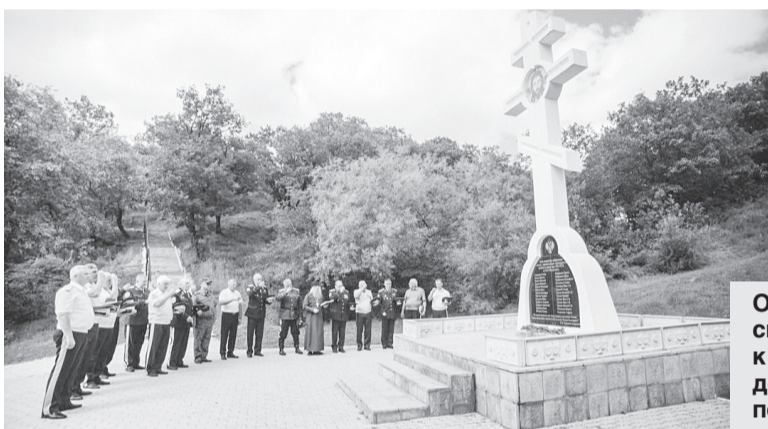
Организаторы и гости «Казачьего сполоха» возложили цветы к памятникам Айгунского договора и казаков-первопроходцев.

та показывали все свои умения и навыки в различных видах стрельбы, сборке и разборке автоматов, владении шашкой, ножевом бою, боксе на бревне, кроссе.