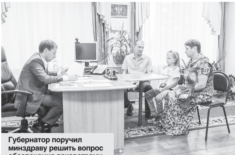
Губернатор поручил минздраву решить вопрос обеспечения лекарствами ребенка с редким заболеванием.

«Перед тем как приступите к работам, согласуйте со всеми жителями план действий», — посоветовал губернатор. — И покажите его мне. Я после 10