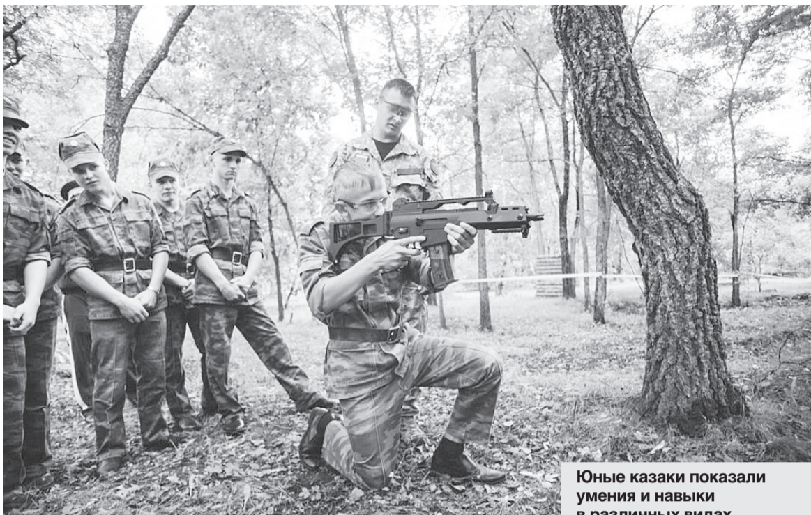
Юные казаки показали умения и навыки в различных видах стрельбы и боя.