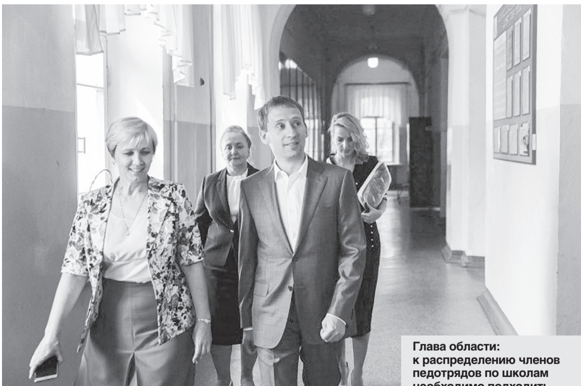
Глава области: к распределению членов педотрядов по школам необходимо подходить индивидуально.

Как заметил губернатор, к распределению по школам членов педотрядов необходимо подходить индивидуально. Например, направлять студентов,