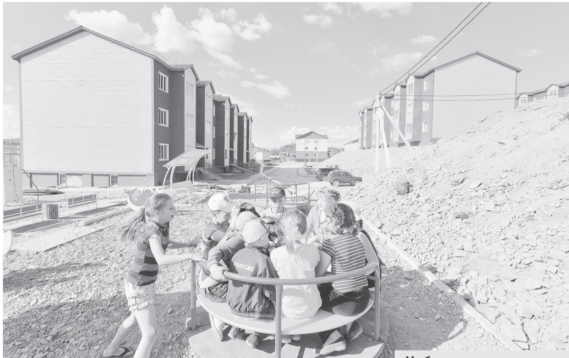
У обманутых дольщиков появится шанс справиться с новосельем.

Как отмечает прокуратура, заменить недобросовестных застройщиков могут другие компании, которые закончат возведение домов. Новый законопроект призван защитить