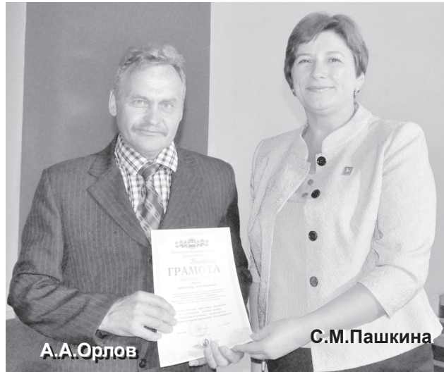
В 2016-2017 учебном году учащиеся Тамбовского района достигли следующих значимых результатов Всероссийского уровня

из МБОУ Тамбовская СОШ принимали активное участие во Всероссийских проектах «ВИДЕОУРОК», олимпиаде по обществознанию, истории, определено 5 победителей.