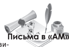
Письмо в «АМ»

Все желающие смогли посетить и Амурской областной краеведческий музей. Теперь с нетерпением ждём продолжения знакомства с историей родного края. Пока открыты только первые страницы: коренные жители, заселение области, занятия и быт предков, животный и растительный мир... А как интересна оказалась история музейного дела самого крупного на Дальнем Востоке краеведческого музея! «Неуважение к предкам есть первый признак безнравственности», – утверждал Пушкин.