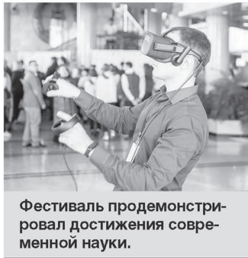
Фестиваль продемонстрировал достижения современной науки.