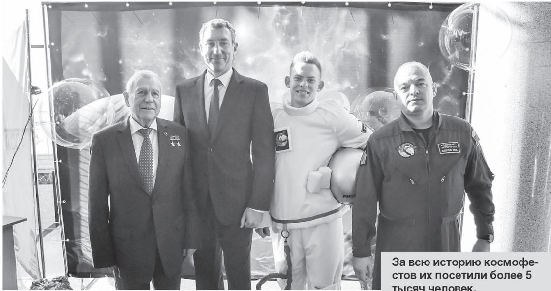
За всю историю космофестов их посетили более 5 тысяч человек.

— Очень много парней и девушек здесь с горящими глазами смотрят на достижения современной науки. Всего за историю фестиваля в нем приняли участие более 5 тысяч человек. И он становится все популярнее, сегодня всех желающих даже не смог вместить большой зал ОКЦ. Я хочу пожелать участникам новых знаний