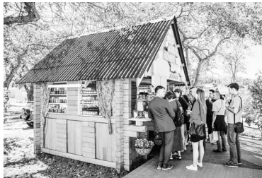
Амурчане привезли на форум мед, печенье и продукты для здорового питания.

Павильон региона — это «инвестиционный паспорт Амурской области», который содержит ключевые инвестиционные проекты, истории успеха. Здесь представлены традиционные, базовые отрасли (энергетика, транспорт, сельское хозяйство). Посетители могут узнать о проектах и сво-