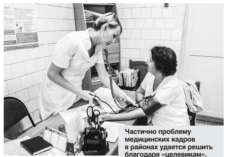
Частично проблему медицинских кадров в районах удается решить благодаря «целевикам».

— Наша область с 2012 года участвует в реализации федерального закона об обязательном медицинском страховании. До