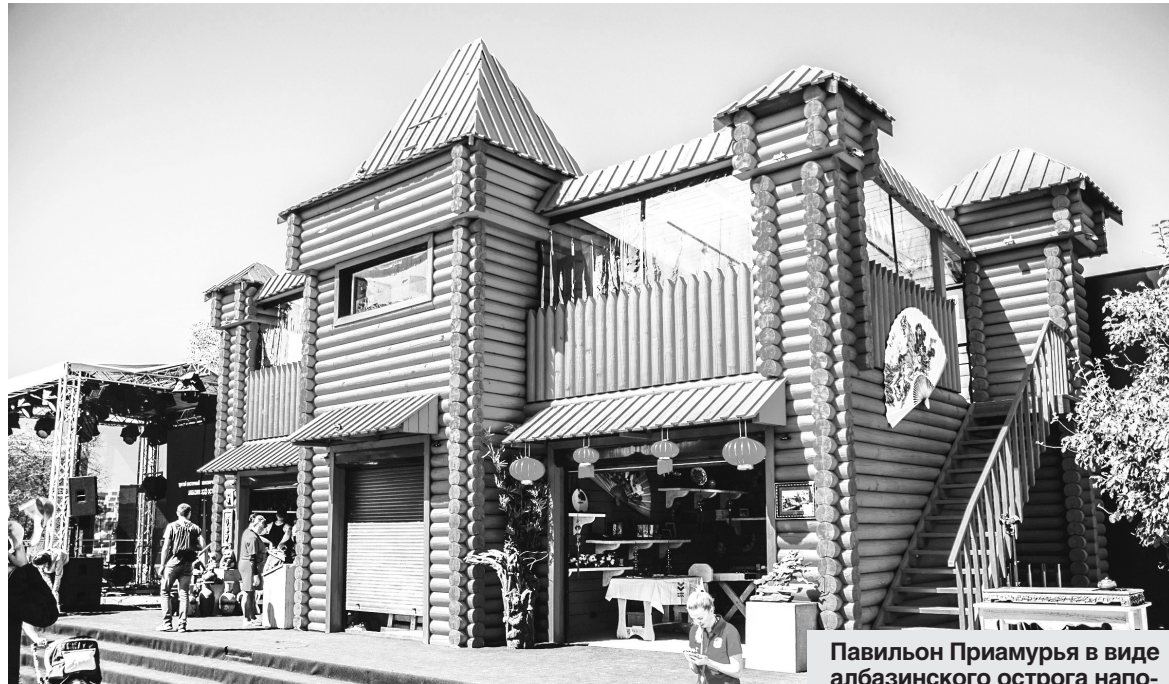
Павильон Приамурья в виде албазинского острога напоминает data-центр.

— За последние десять лет область зарекомендовала себя как площадка для реализации уникальных проектов. Кроме того, мы продолжаем работать в гидроэнергетике, открываем