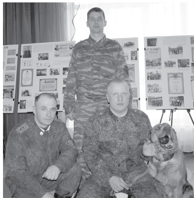
Воины Николаевского учебного Центра с пограничной собакой