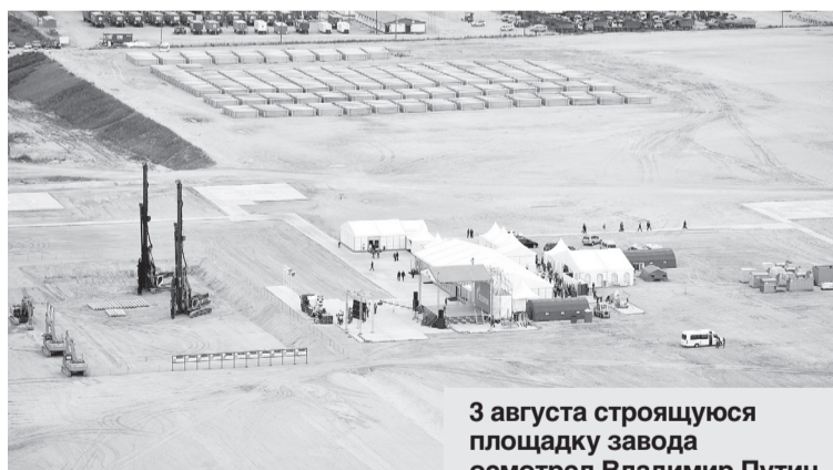
3 августа строящуюся площадку завода осмотрел Владимир Путин, а после дал команду на торжественную заливку фундамента.