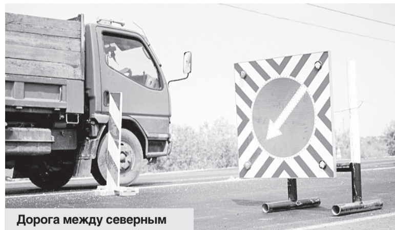
Дорога между северным поселком и городом гидроэнергетиков находится на особом контроле.

Ремонты дорог должны закончиться в области к 30 сентября. Особое внимание было уделено объектам, на которые поступали жалобы от амурчан во время работы «Открытого правительства». Среди них подъезд к поселку Магдагачи, обход города Шимановска, подъезд к Екатеринославке, участки автодорог Благовещенск — Свободный, Благовещенск — Бибиково, Тыгда — Зея. При этом дорога между северным поселком и городом гидроэнергетиков находится на особом контроле. Подрядчик здесь ведет