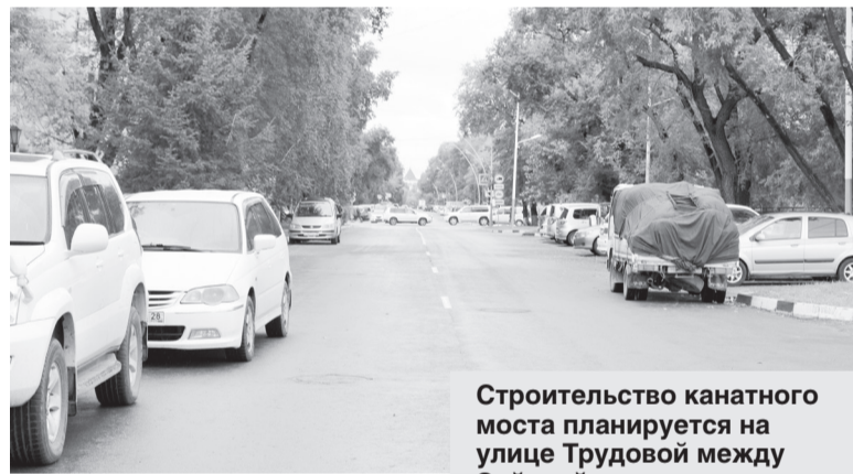
Строительство канатного моста планируется на улице Трудовой между Зейской и Краснофлотской.