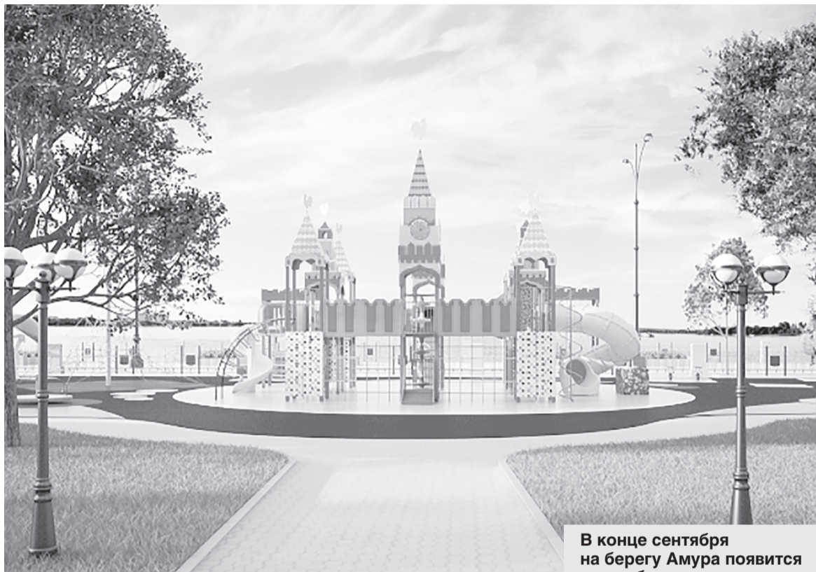
В конце сентября на берегу Амура появится самая большая игровая в Благовещенске.