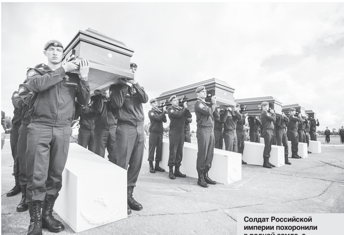
Солдат Российской империи похоронили в родной земле, с воинским почестями и по православным традициям.

— Согласно имеющимся данным, на православном кладбище в Китае было захоронено не менее 320 человек. По архивным документам нам удалось установить 207 фамилий. Это уроженцы большинства территорий Российской империи — более 60 регионов, которые сейчас входят в состав Российской Федерации, а также Украины, Беларуси, Прибалтики и даже Польши, — рас-