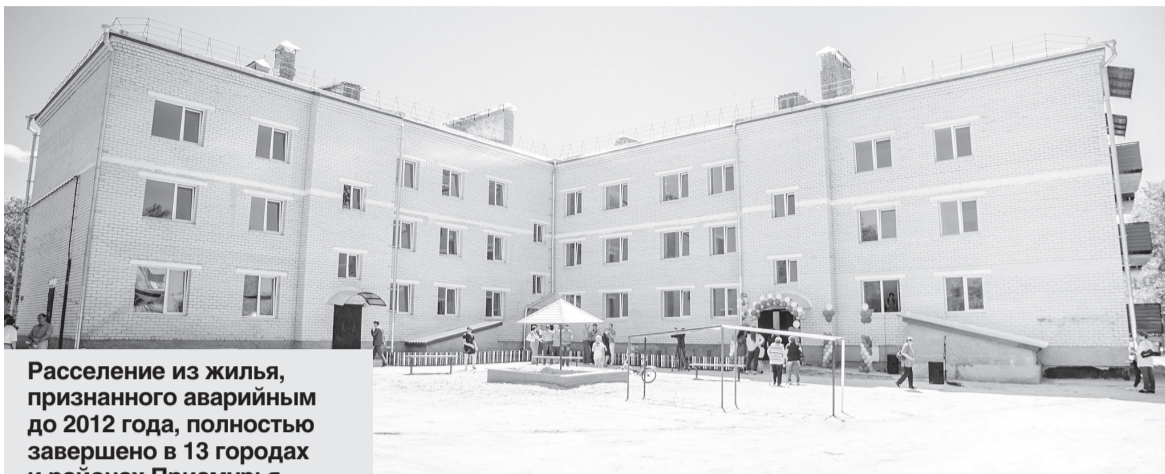
Расселение из жилья, признанного аварийным до 2012 года, полностью завершено в 13 городах и районах Приамурья.

На расселение амурчан из ветхих и аварийных домов должна добавить денег федеральная казна. «С учетом уже проделанной работы по расселению граждан в области имеется еще 118 тысяч квадратных ме-