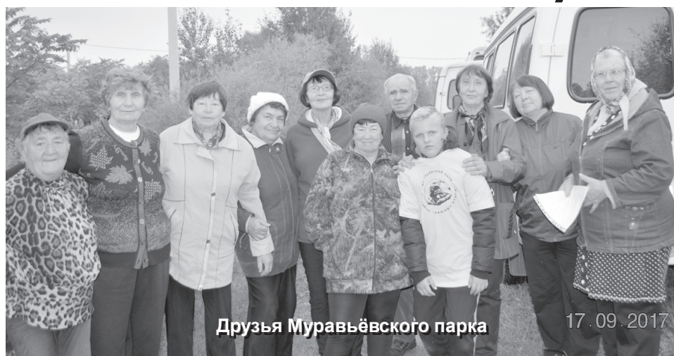
Друзья Муравьёвского парка