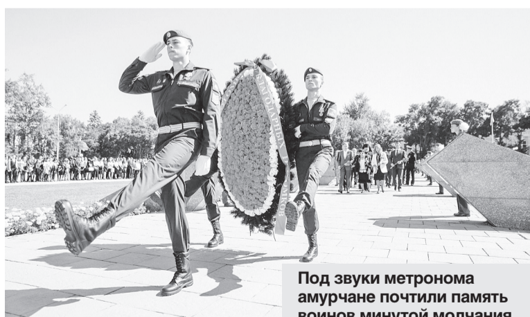
Под звуки метронома амурчане почтили память воинов минутой молчания.