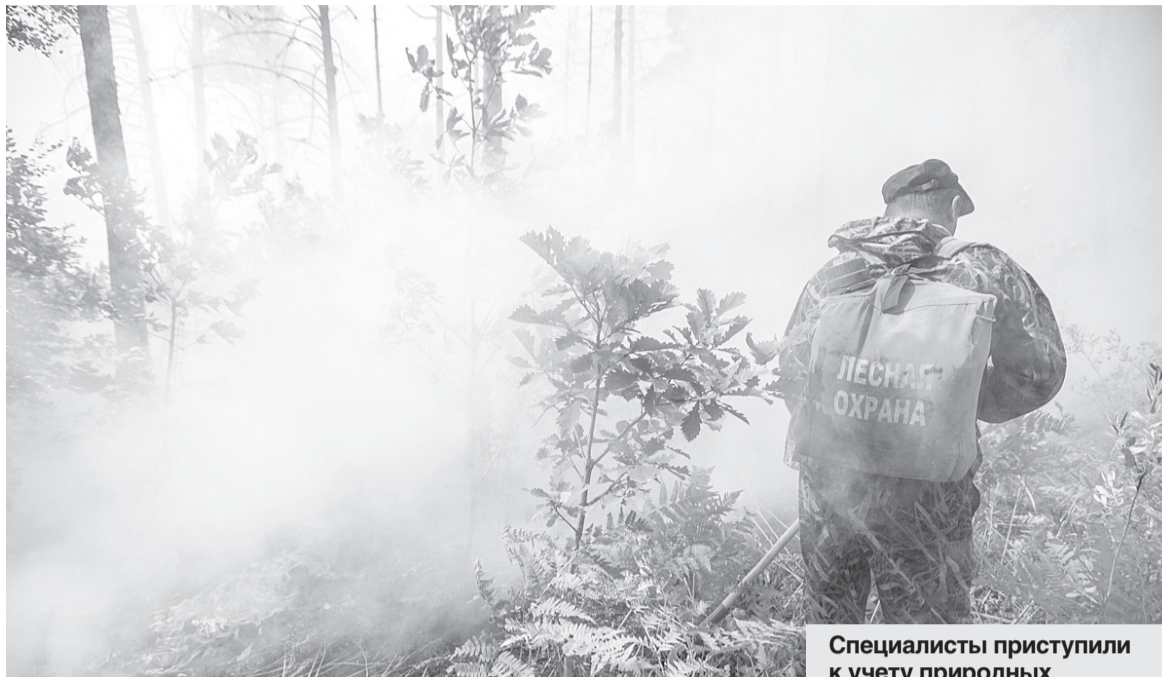
Специалисты приступили к учету природных возгораний и контролю пожароопасной ситуации в лесах.

Главам муниципальных районов и городских округов рекомендовано создать на местах оперативные штабы на период действия особого противопожарного режима, усилить патрулирование территорий населенных пунктов и прилегающих