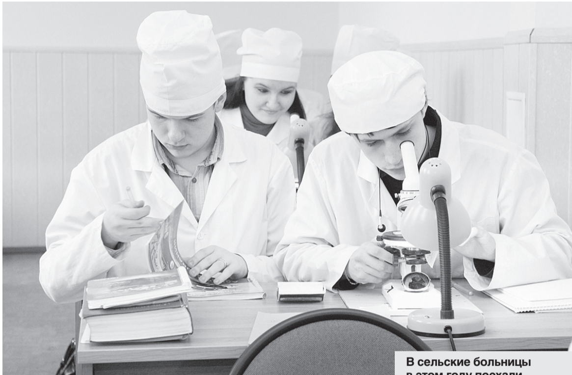
В сельские больницы в этом году поехали работать 55 молодых докторов.