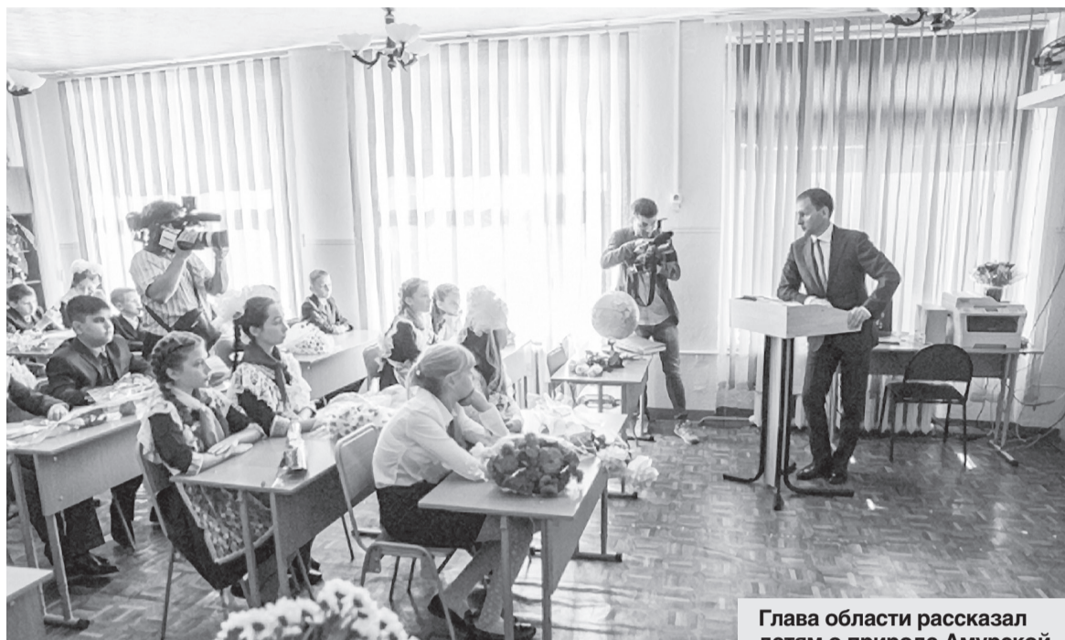
Глава области рассказал детям о природе Амурской области.

— Мы все должны беречь природу. Даже в таких мелочах, как бросать мусор на дорогу. Природа — это наш дом. Вы же свои дома стараетесь держать в чистоте, так же и с природой, — обратился глава региона. — Надо любить все живое: цветок, птенца, щенка, защищать их. Может, те, кто вырос и стал браконьером, не были к этому