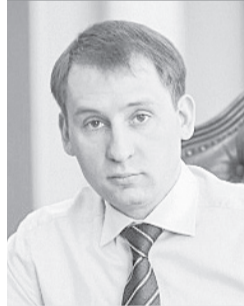
Александр Козлов, губернатор Приамурья:

оплату проезда. С инициативой помощи в оплате проезда мы вышли на всю страну, потому что такое положение везде.