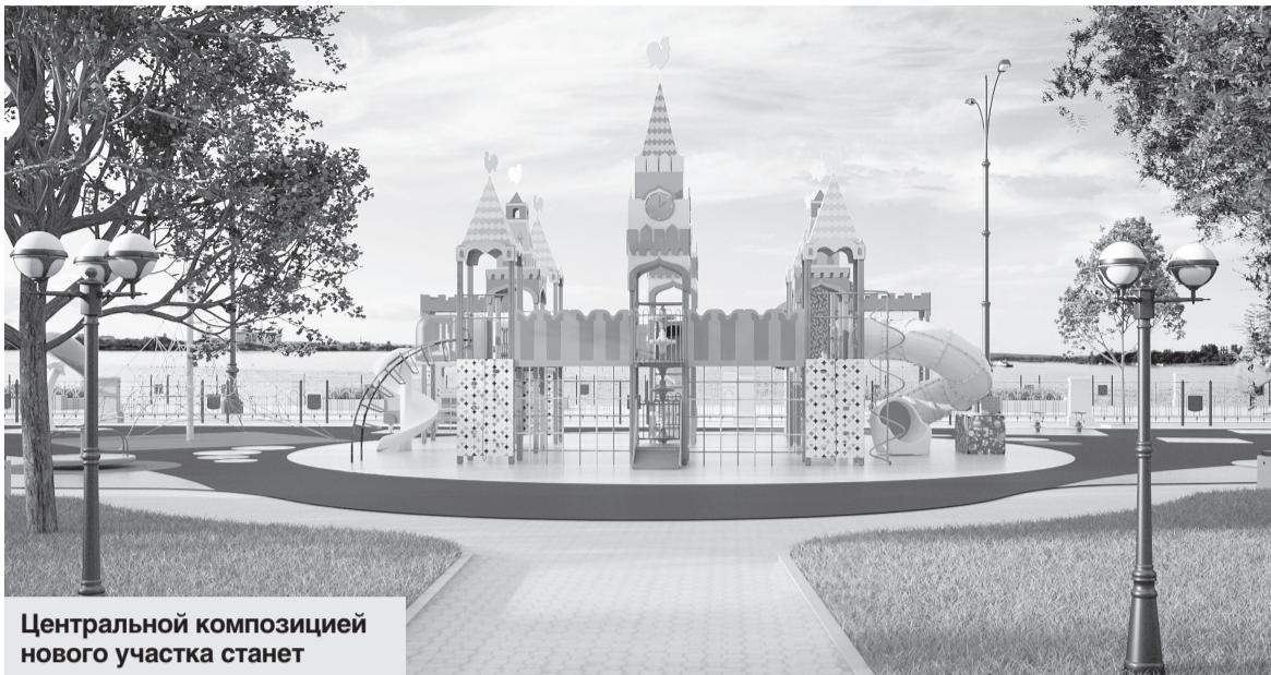
Центральной композицией нового участка станет стометровая детская площадка.

Губернатор Приамурья Александр Козлов поставил задачу обязательно обустроить на новом участке детскую площадку. Еще в качестве мэра Благовещенска он доказывал необходимость та-