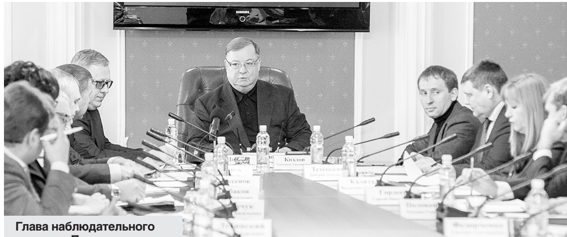
Глава наблюдательного совета в Приамурье строят жилье высокого качества, которое не стыдно предлагать людям.

— Очевидно, что программа по переселению будет продлена. Это решение президента Владимира Путина. Людей нельзя оставлять в аварийном жилье, в нем просто опасно жить. Вопрос в том, какие это будут формы реализации программы. Сейчас готовится новый закон, новая нормативная база, они должны быть готовы