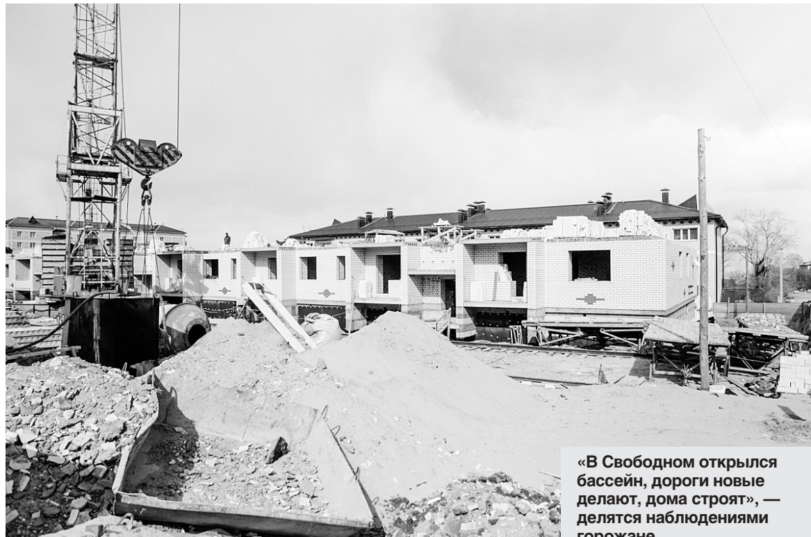
«В Свободном открылся бассейн, дороги новые делают, дома строят», — делятся наблюдениями горожане.

— Центр добычи полезных ископаемых сосредоточен на севере области. Его основа — проекты золотодобычи, освоение угольных месторождений, таких как Огоджа. В комплексном плане предполагается развитие инфраструктурных и социальных проектов, привязанных к территории севера. Следующая точка роста — туристическо-рекреационная зона. Она сосредоточена на территориях, граничащих с Китаем, это Благовещенск и Благовещенский район. Мы связываем ее с развитием торговых и туристических отношений с Поднебесной, транспортно-логистическими проектами, которые призваны развивать и туризм, это и строительство моста через Амур, — перечисляет глава минэкономразвития.