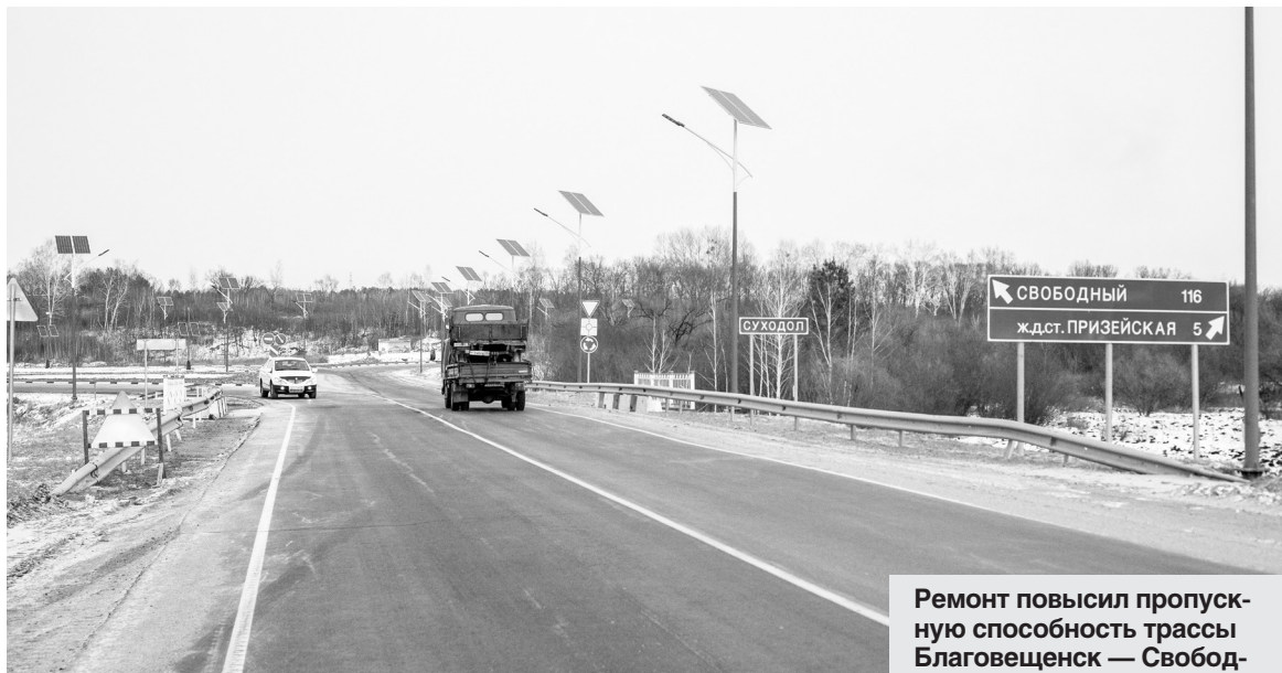
Ремонт повысил пропускную способность трассы Благовещенск — Свободный с 4 до 6 тысяч тонн машин в сутки.

За год дорожники обустроили в населенных пунктах области 14 новых пешеходных переходов (девять возле школ) и поставили девять светофоров. Эти меры помогли снизить число ДТП, случившихся из-за неудовлетворительных условий на дорогах: с 41 в прошлом году до 28 в этом.