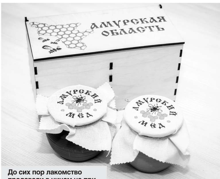
До сих пор лакомство продавали в ничем не примечательной пластиковой и стеклянной таре.

Над оригинальным дизайном вместе работали продавцы меда и амурские умельцы, которые и создали горшочки, короба и вышивки на салфетках. Воплотить идею в жизнь помогли специалисты областного минсельхоза и регионального министерства внешнеэкономических связей, туризма и предпринимательства. Подарок со вкусом, по оценкам последнего ведомства, будет стоить около тысячи рублей. Но представленная подарочная упаковка — базовый