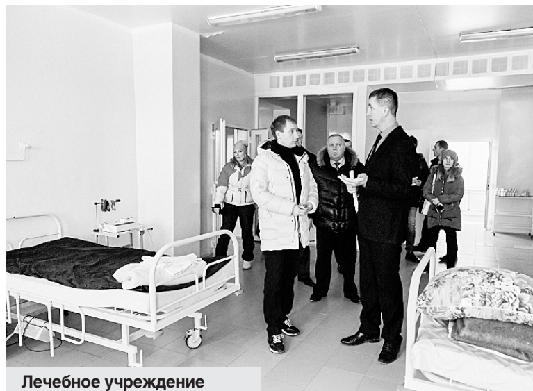
Лечебное учреждение будет принимать пациентов не только Тынды и Тындинского района, но и Зейского и Сковородинского районов.

Сейчас завершается ремонт в корпусе, где уже после Нового года разместится детская поликлиника. В новом здании