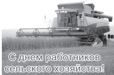
С днем работников сельского хозяйства!