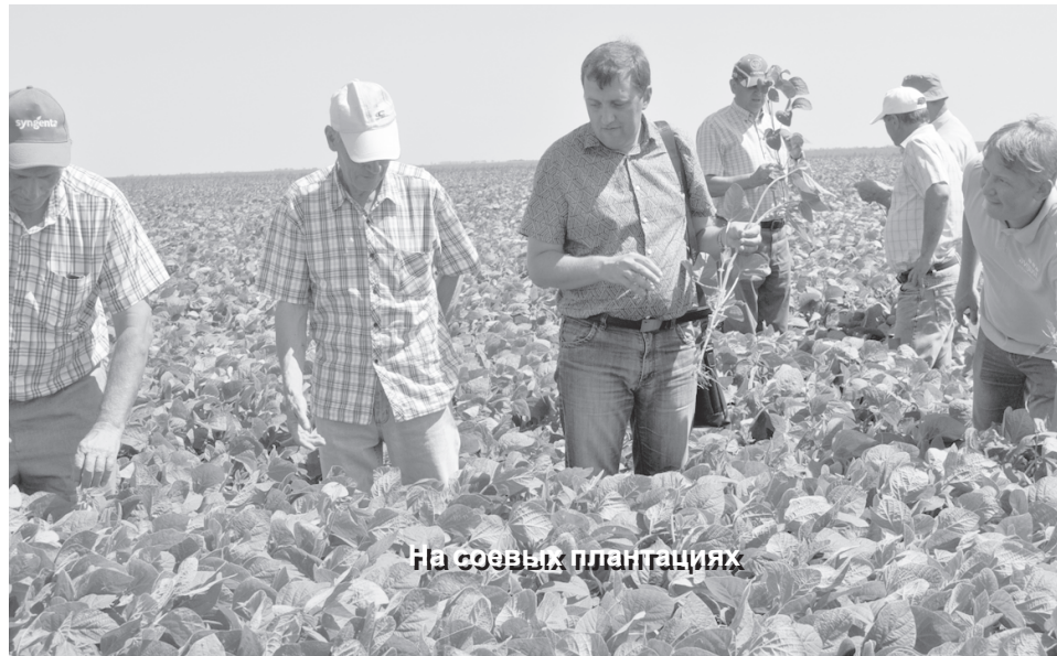
На соевых плантациях