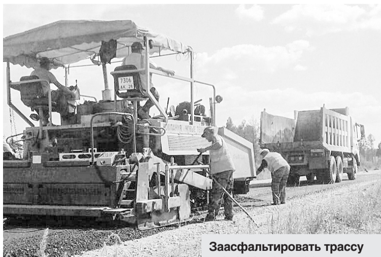
Заасфальтировать трассу глава региона поручил в прошлом году после встречи с жителями района.