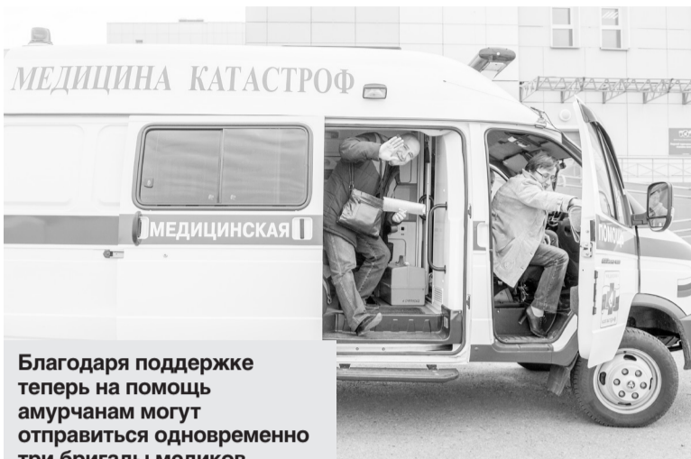
Благодаря поддержке теперь на помощь амурчанам могут отправиться одновременно три бригады медиков.

Необходимые аукционы на закупку авиационной услуги для оказания скорой специализированной медпомощи уже провели. Реализация проекта по развитию санавиации началась в области с 1 июля. За первые 12 дней бри-