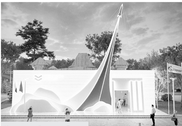
Космодром Восточный — один из главных брендов Амурской области на ВЭФ.