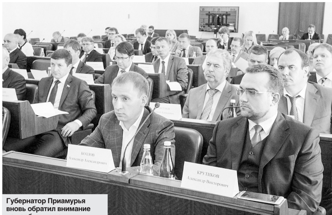
Губернатор Приамурья вновь обратил внимание на необходимость строительства взлетно-посадочной полосы в Благовещенске.

Губернатор Приамурья вновь обратил внимание на необходимость строительства взлетно-посадочной полосы в Благовещенске. Один из главных аргументов