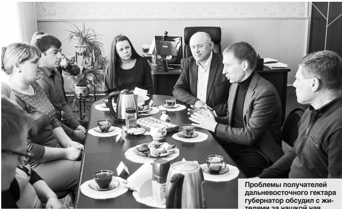
Проблемы получателей дальневосточного гектара губернатор обсудил с жителями за чашкой чая.

— Есть специальное кредитование для получателей дальневосточного гектара, которое предлагает «Почта-банк»: кредит до 600 тысяч рублей, залог не нужен, ставка — от 8,5 до 10,5%. Можно подать онлайн-заявку. Однако вы получите не чистые деньги: банк перечислит средства в аккредитованный