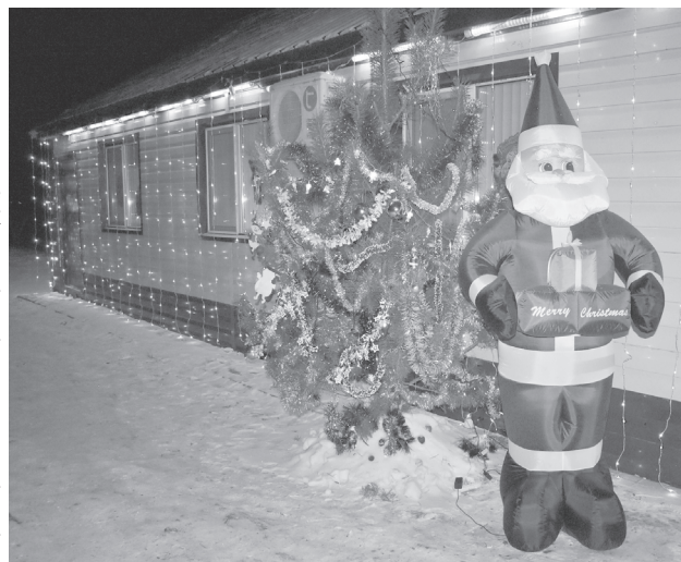
Кафе «На бугре»

Жизнь сегодня нелегка, но с депрессивным настроением нам всем надо бороться и создавать в душе праздник!