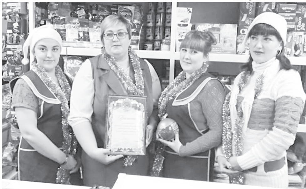
Коллектив магазина «Успех»