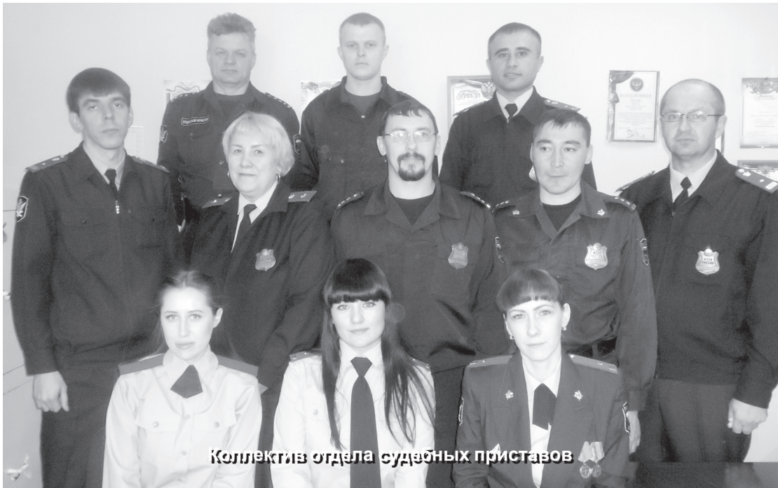
Коллектив отдела судебных приставов

В преддверии профессионального праздника поздравляю коллег с Днем судебного пристава. Наша нелегкая работа заключается в том, чтобы претворять в жизнь решение суда, следуя каждой букве закона. Хочется пожелать судебным приставам правильных решений, смелости, отваги в нашей непростой работе, ведь она сложна как физически, так и морально. Также хочется пожелать, чтобы все трудности исполнения решений были рабочими моментами, а в домах сотрудников царил мир, уют, спокойствие и взаимопонимание.