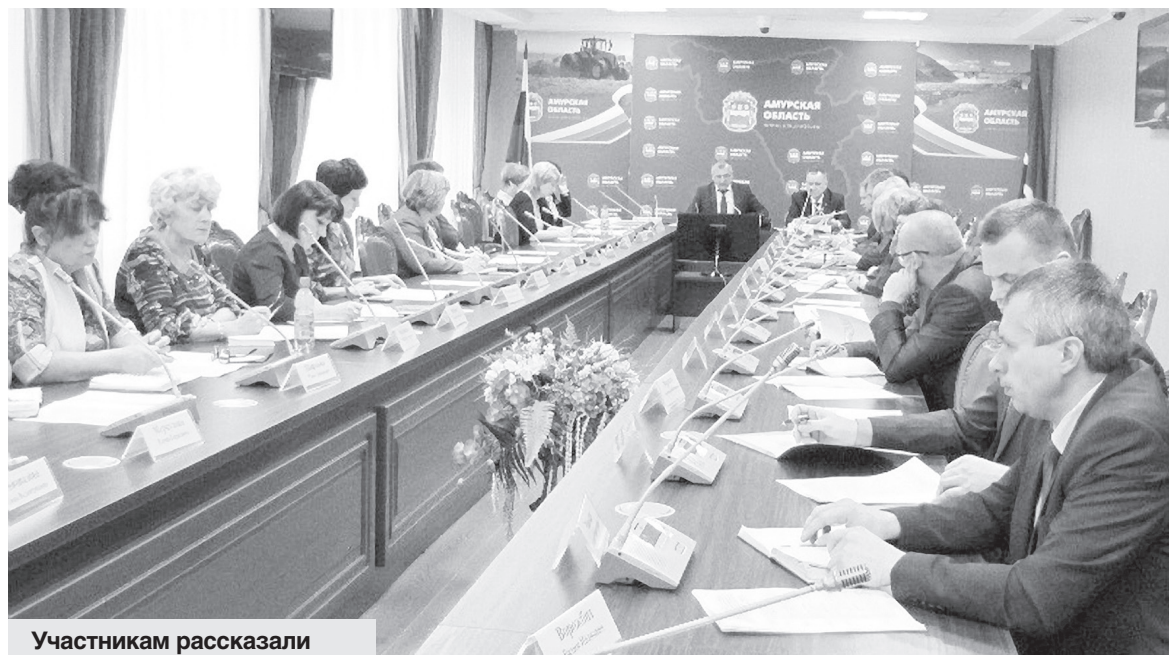
Участникам рассказали о правовых основах государственной национальной политики в России.