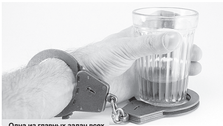
Одна из главных задач всех ведомств - легализация алкогольного рынка.

С начала 2017 года министерством ВЭСтП проведе-