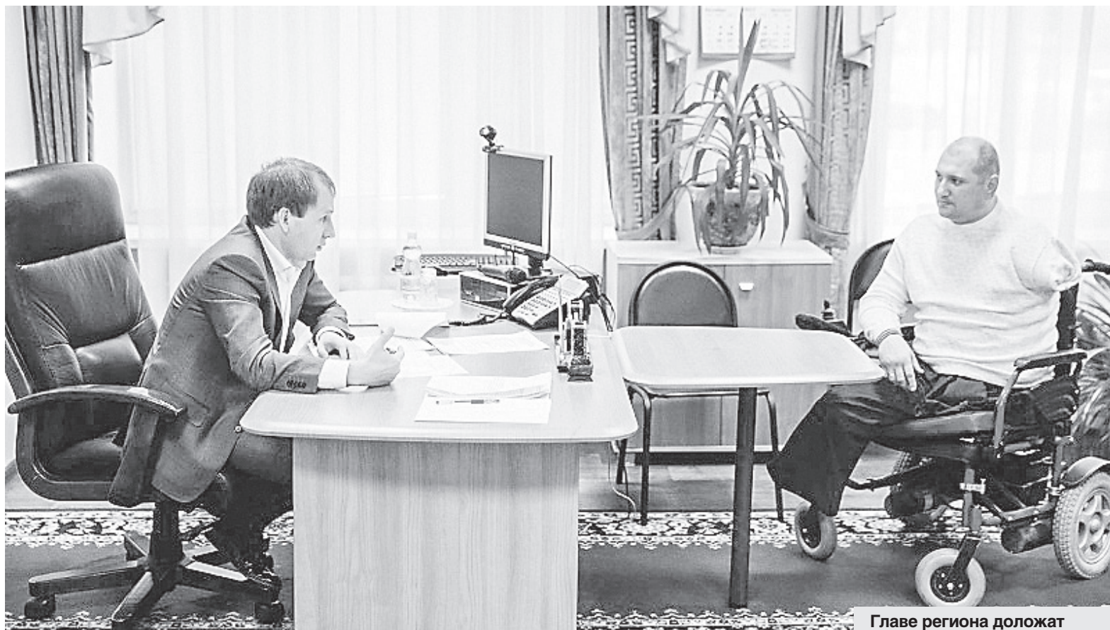
Главе региона доложат о том, что сделано для решения проблем заявителя.

Губернатор взял на контроль решение проблемы инвалида из Михайловского района