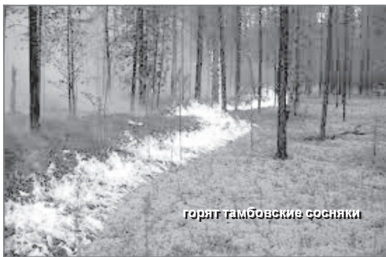
горят тамбовские сосняки