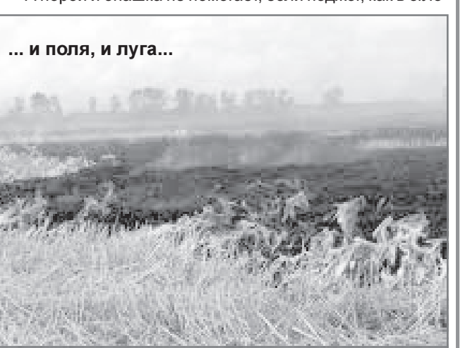
... и поля, и луга...

А порой и опашка не помогает, если поджог, как в с.Лозовое, происходит в самой лесопосадке. В эти дни зафиксировано несколько термоточек в Муравьевке, Лиманном, Гильчине, Садовом, Тамбовке.