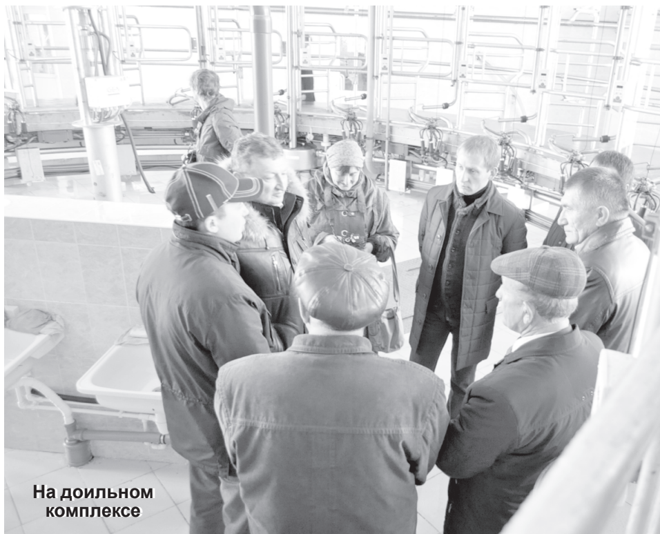
На доильном комплексе

русели» во время всего вращения доильной установки. Контрольная панель в центре доильного зала позволяет оператору отслеживать начало и окончание дойки, скорость процесса и т.д.