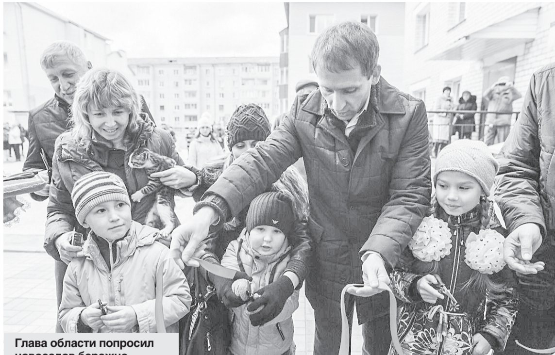
Глава области попросил новоселов бережно относиться к своим новым домам.

Еще два многоквартирных дома для переселенцев из ветхого жилья на минувшей неделе сдали в Свободном. Новоселье справили 59 семей. Ключи