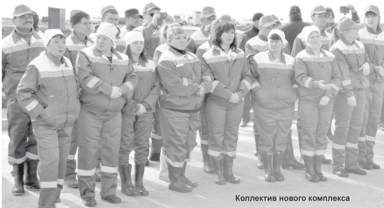
Коллектив нового комплекса