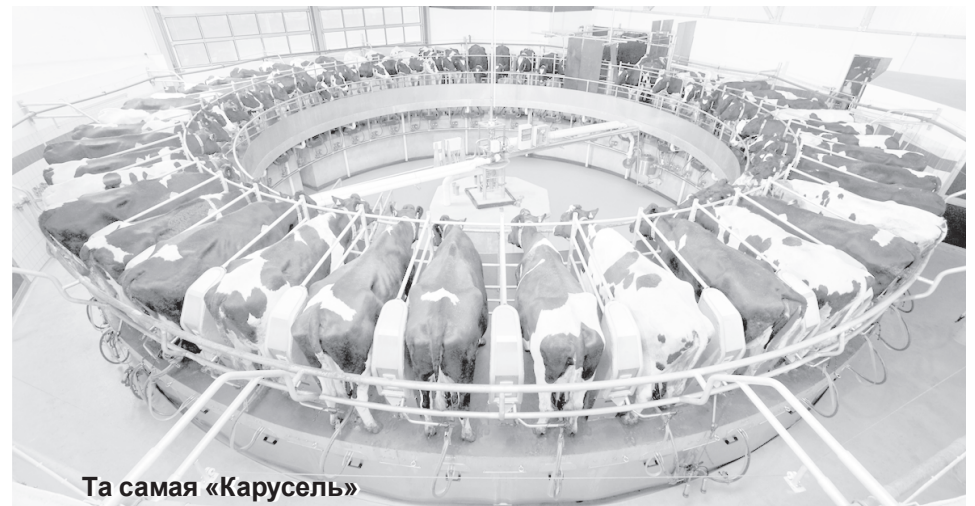
Та самая «Карусель»

тором на мониторе за пультом управления. Коровы размещаются на медленно вращающейся доильной установке. Предварительно оператор подготавливает коров к процессу дойки – обрабатывает вымя и присоединяет доильные стаканы по очереди к каждой корове. Коровы остаются в стойлах «Ка-