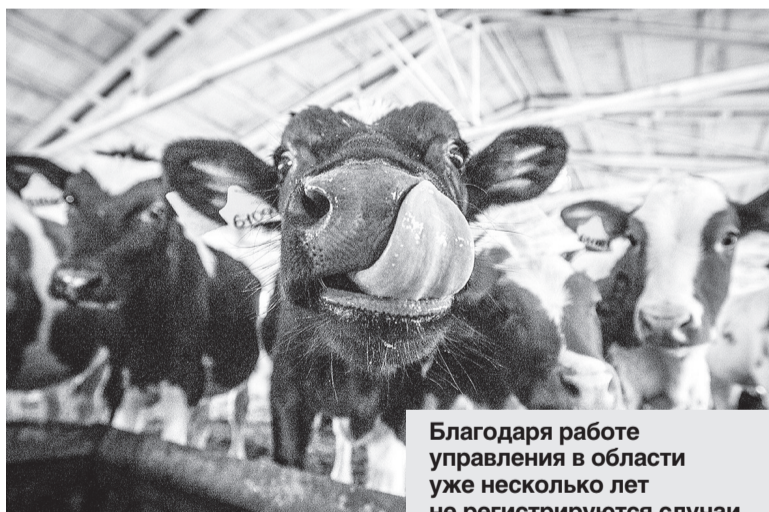
Благодаря работе управления в области уже несколько лет не регистрируются случаи бешенства у животных.

Благодаря усилиям специалистов управления на территории