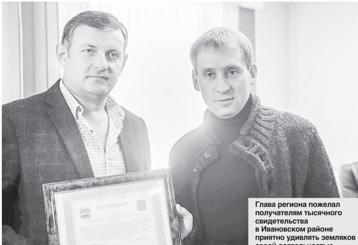
Глава региона пожелал получателям тысячного свидетельства в Ивановском районе приятно удивлять земляков своей деятельностью.

— В области выдано уже более 3 тысяч 700 свидетельств.