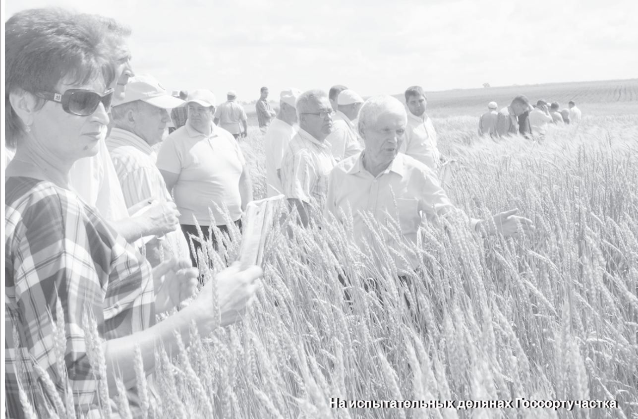
На испытательных делянках Госсортучастка

Кстати, во вторник, 27 июля, состоялся традиционный объезд полей руководителями и главными агрономами хозяйств района. Отчет об этом читайте в следующем номере газеты.