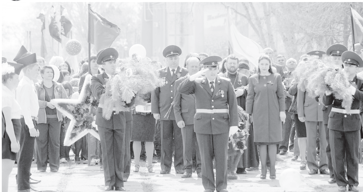
ТАМБОВЧАНЕ В 71-Й РАЗ ОТМЕТИЛИ ДЕНЬ ПОБЕДЫ. Дата пусть не юбилейная, но не менее значимая. Каждое историческое событие оставляет свой след в судьбе страны. Память народная о подвигах своих героев – основа национального самосознания