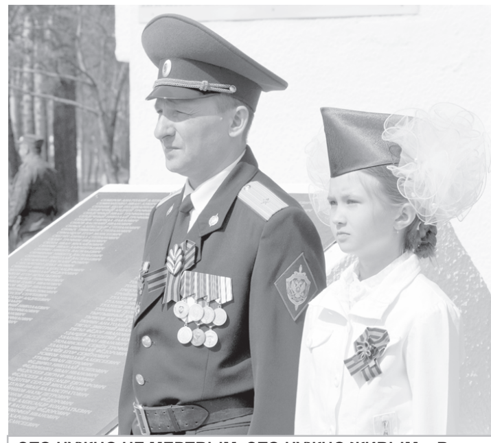
ЭТО НУЖНО НЕ МЕРТВЫМ, ЭТО НУЖНО ЖИВЫМ... Вахты памяти традиционно несут воины-пограничники и школьники. Защищая Родину от фашистских агрессоров, с полей сражений не вернулись почти 40 тысяч амурцев

ПОКЛОНИМСЯ ВЕЛИКИМ ТЕМ ГОДАМ. Поклонимся им, известными безымянным, погибавшими сотнями тысяч, чтобы мог родиться новый мир – Мир без войны!