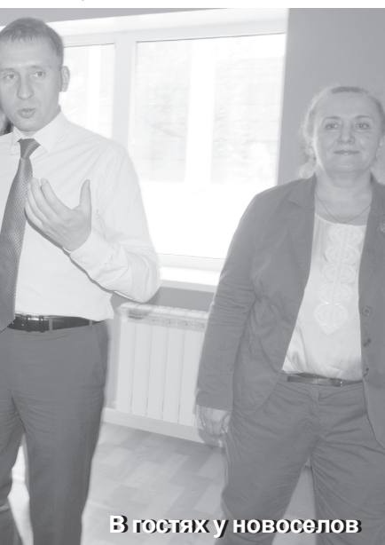
В гостях у новоселов

По ходу встречи министру задавалось много вопросов из зала, в частности, по обслуживанию детей в районной поликлинике, по стоматологической помощи в Тамбовке и селах района. Было решено, что в с. Чувяка в 2017 году будет установлен мо-