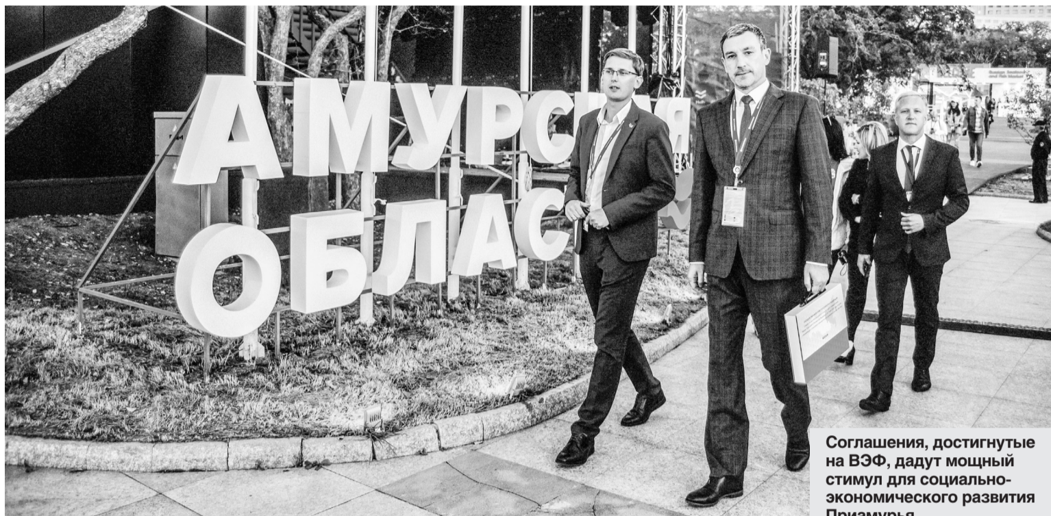
Соглашения, достигнутые на ВЭФ, дадут мощный стимул для социально-экономического развития Приамурья.

Главные итоги работы Амурской области на Восточном экономическом форуме