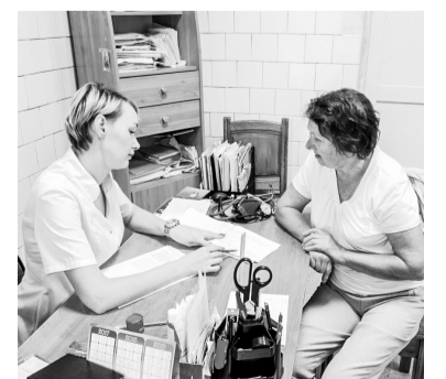
При необходимости после консультации пациентов отправят на дообследование.

Также на территории всех муниципальных образований области с 17 по 21 сентября в целях ранней диагностики рака головы и шеи будут проводить бесплатные осмотры мультидисциплинарные бригады врачей учреждений, подведомственных минздраву региона. Побывать на консультации специалистов можно в торговых центрах, домах культуры, школах и на крупных предприятиях.