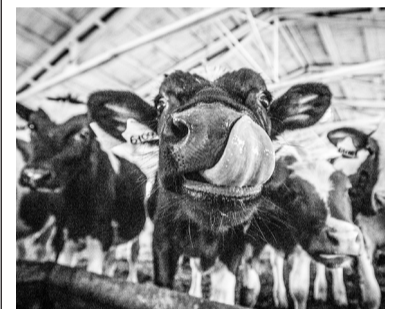
Коровы поступят в три района по грантовой программе.

В общей сложности фермеры получат 34 племенные коровы. В этом году обладателями грантов стали 17 начинающих фермеров и 4 владельца семейных ферм. Амурчанам помощь составит до 3 миллионов рублей. Средства выделяются из областного бюджета для софинансирования затрат крестьянского (фермерского) хозяйства на покупку животных, техники и семян, сообщили в пресс-службе правительства региона.