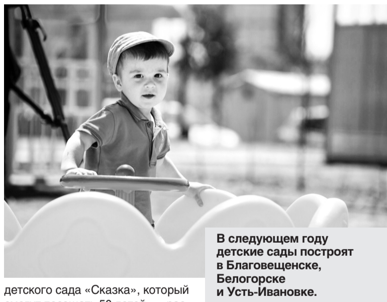
В следующем году детские сады построят в Благовещенске, Белогорске и Усть-Ивановке.

— К сожалению, с открытием новой группы проблема очередей в дошкольные образовательные учреждения остается нерешенной. В местах в детские сады в настоящее время нуждаются 20 ребят. Однако наша работа не заканчивается. В этом году выделено финансирование на разработку проектно-сметной документации на строительство нового корпуса