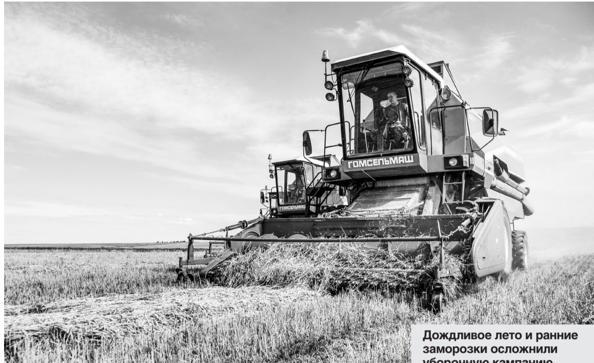
Дожливое лето и ранние заморозки осложнили уборочную кампанию.

— Ряд крупных хозяйств до сих пор не могут завершить уборку пшеницы и овса, — рассказал он. — Но, я считаю, наши аграрии, несмотря на сложную ситуацию, сделали все возможное. На сегодняшний день намолочено 355