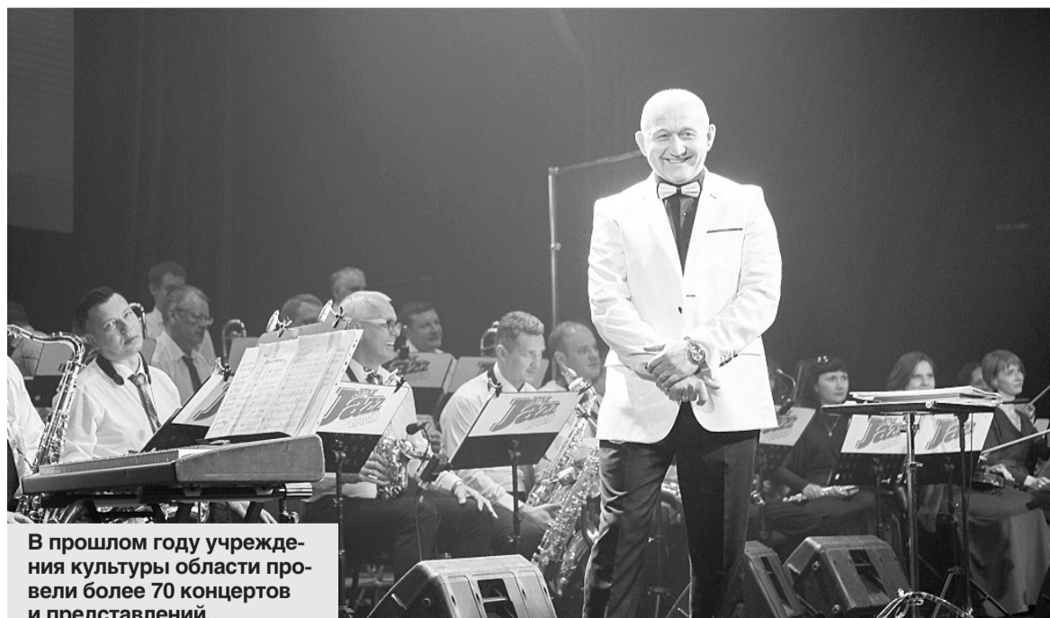
В прошлом году учреждения культуры области провели более 70 концертов и представлений.

— Культура в регионе обладает достойным потенциалом: это театры, филармония, музеи, библиотеки, клубы, детские школы искусств. Мы стараемся улучшать их материальное положение. В сельских поселениях области появились новейшие библиобусы, первый на Дальнем Востоке Центр культурного развития в Белогорске отметил годовщину со дня открытия. Сегодня отрасль культуры становится все более привлекательной, все чаще в ведомственные учреждения трудоустраивается молодежь, и это радует, — отметил глава области.