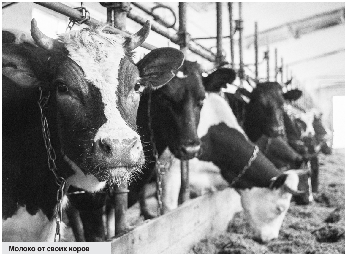
Молоко от своих коров исследуют крупные сельхозпредприятия, имеющие статус племенных репродукторов.

Проведенные за два месяца исследования показали, что в целом молоко амурских