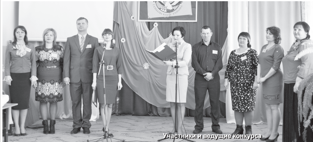
Участники и ведущие конкурса

И ведь не всегда дети приходят в школу с поло-