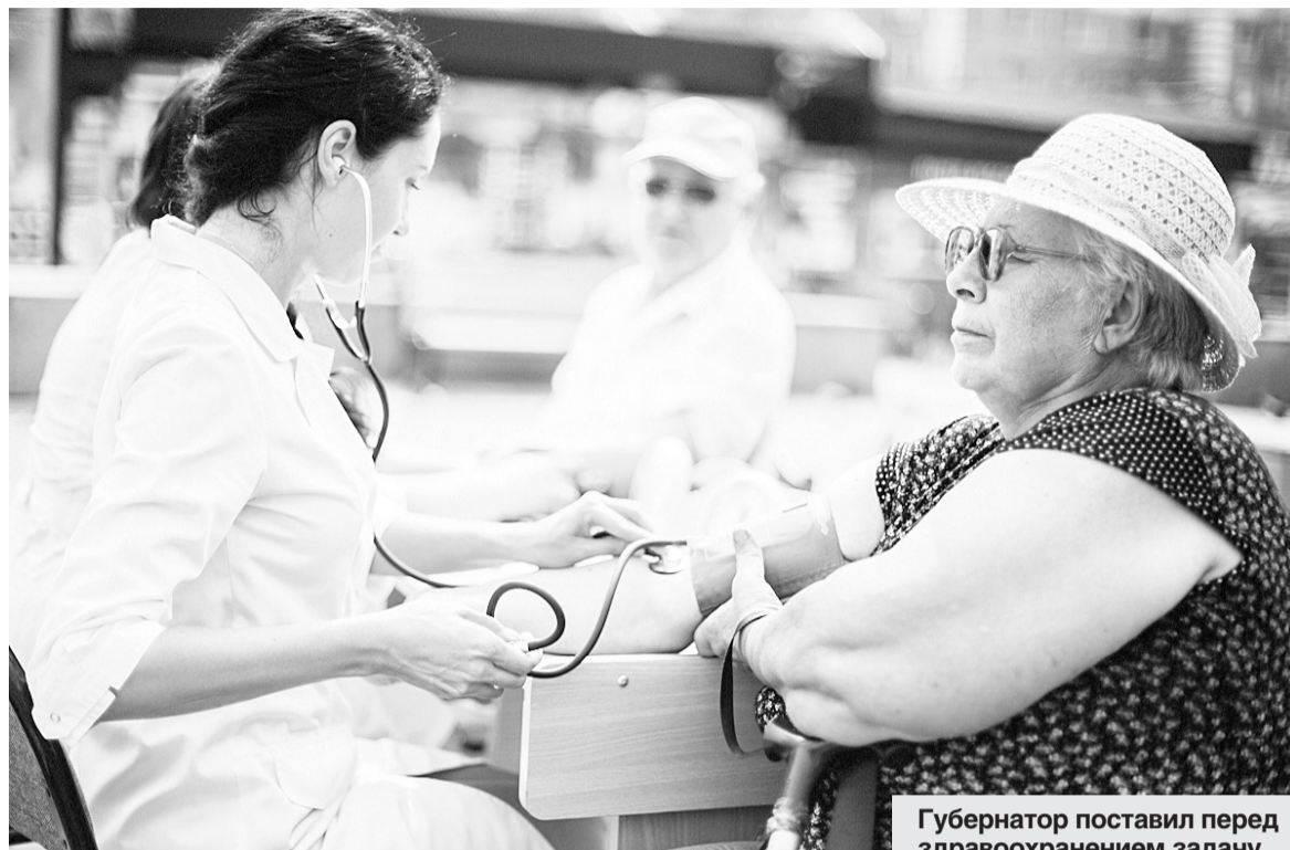
Губернатор поставил перед здравоохранением задачу развивать в области геронтологическую медицину.

Зампред отдельно остановилась на таких параметрах работы системы здравоохранения, как показатель младенческой смертности, уровень детского