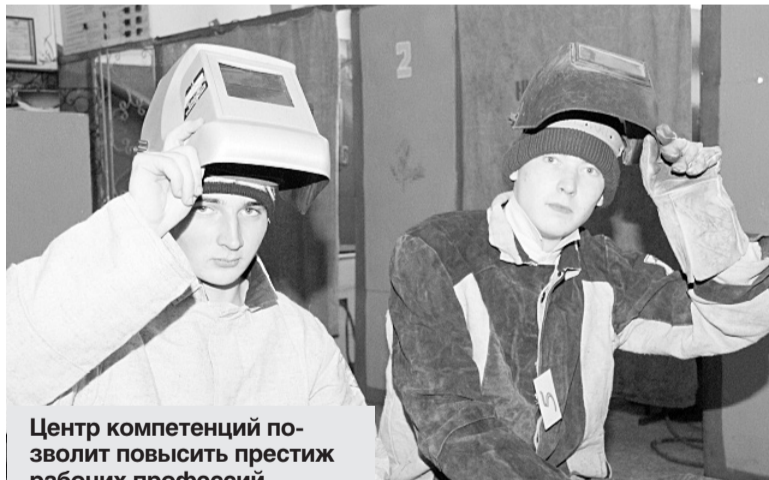
Центр компетенций позволит повысить престиж рабочих профессий.

Сейчас региональное Минобрнауки составляет «дорож-